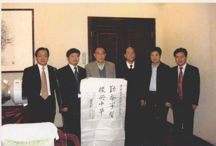
曹将军上将为母校六十华诞赠送神七模型、题词并和市、校领导合影留念