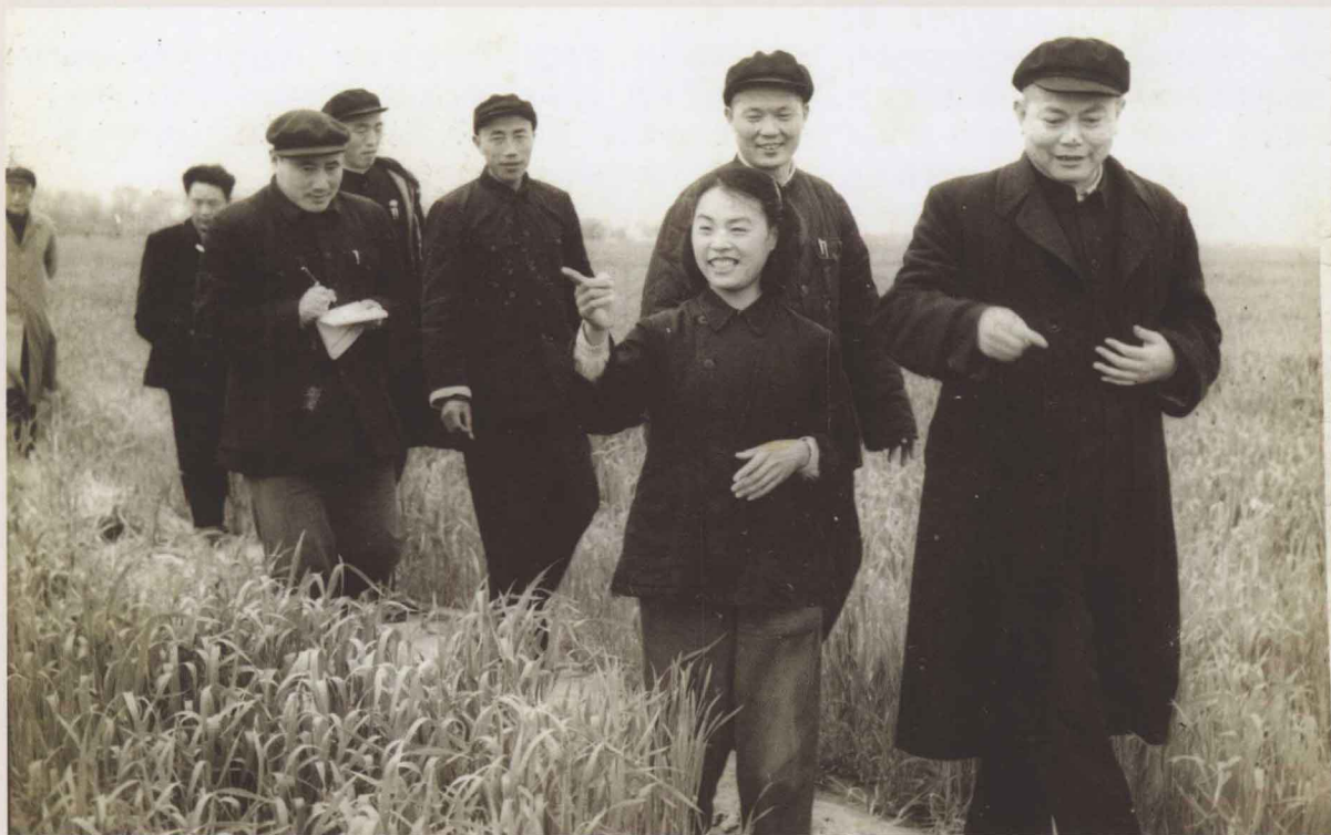
1958年4月14日，中共中央政治局委员、国务院副总理李先念（右一）到郾城农村视察。