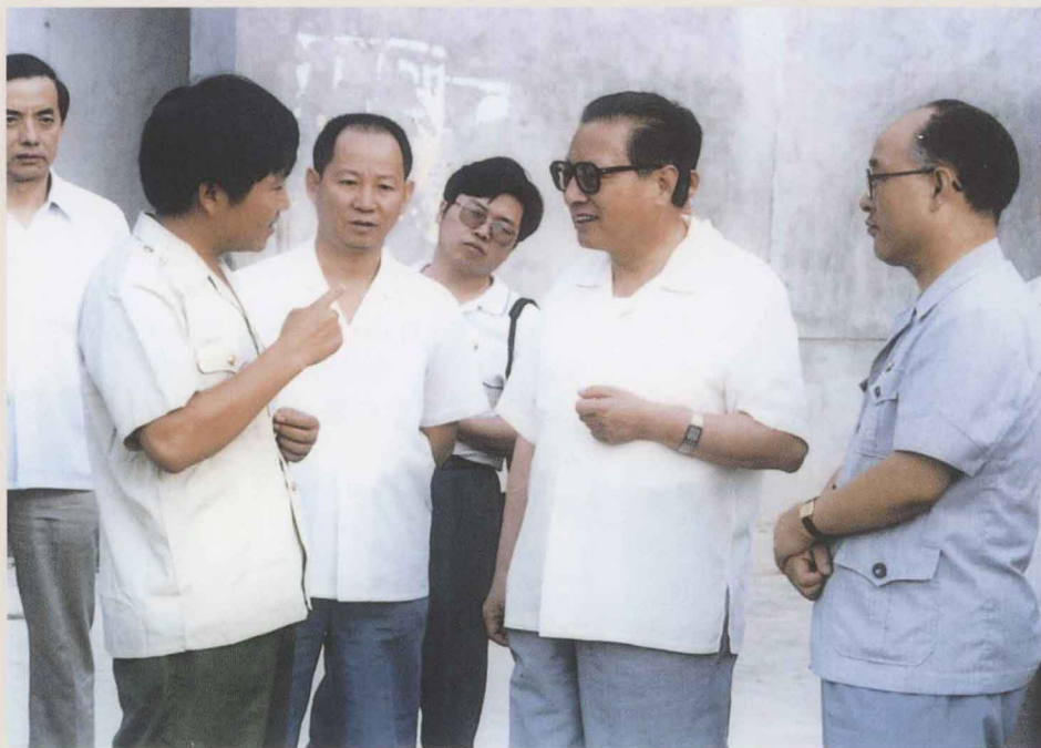
1990年8月24日至25日，中共中央政治局常委乔石（右二）到漯河视察。