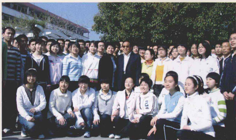
曹刚川上将任省委常委、宣传部长、副省长孔玉芳的陪同下与09届宏志班学生亲切合影