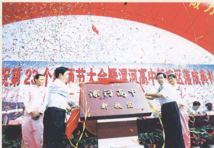
市领导为新校区揭牌

这个目标目前也已提前完成，继开办面向全省招生的“宏志班”后，2006年又成功开办漯河市唯一一个“希望班”，为全省培养高级武警指挥人才的“国防生班”2008年也顺利落户；第三步，从2011年至2015年，再用五年的时间，创建成为中华名校，实现高层次、全方位、多领域可持续育人的战略决策。这个目标正稳步实施。