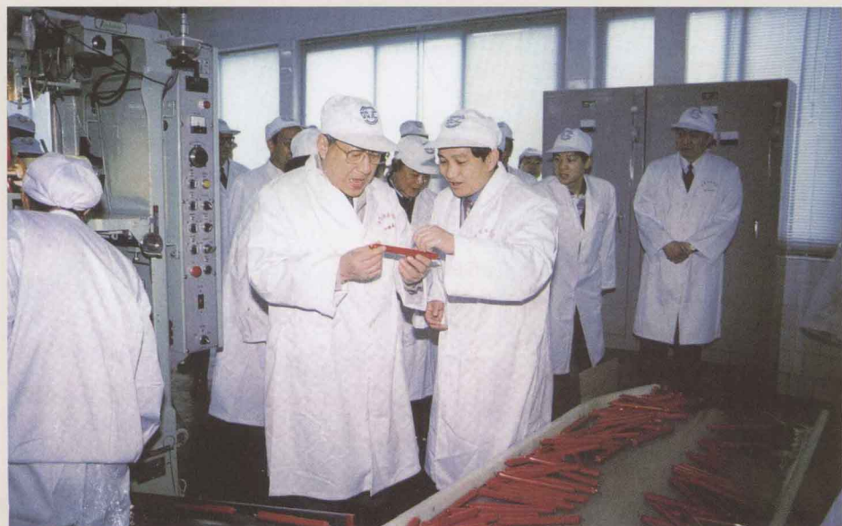
1996年4月12日至13日，中共中央政治局委员、国务院副总理李岚清（中）到漯河视察。