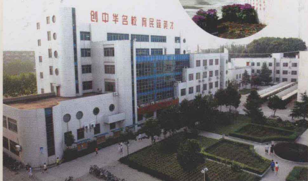
漯河高中核心建筑——科技楼