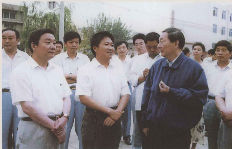
1995年6月10日，中共中央政治局常委、国务院副总理朱镕基（前右一）到南街村视察。