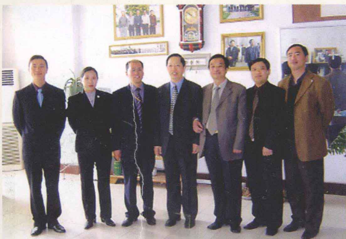
省教育厅原厅长蒋笃运莅临学校视察

沙澧河畔豫中名校，字圣故里英才摇篮。漯河高中，1948年建校，1997年被漯河市委、市政府确定为漯河市唯一一所申办“全国示范性高中”的学校；2003年经河南省教育厅批准，成为漯河市唯一一所具备承办“宏志班”资格的学校；2005年2月被河南省教育厅命名为河南省首批示范性高中。漯河高中是全国信息化建设先进单位、全国校园文化建设先进单位、全国师德建设先进集体、全国教育系统先进集体、全国教育科学规划教育部优秀科研基地、全国“五四”红旗团委、河南省新课程改革样本校、省卫生先进单位、省化学教学科研基地学校、省依法治校示范校、省安全管理先进学校、省“五好”党组织、市文明单位、市人才工作先进单位、市窗口学校、市高中教学工作先进单位。