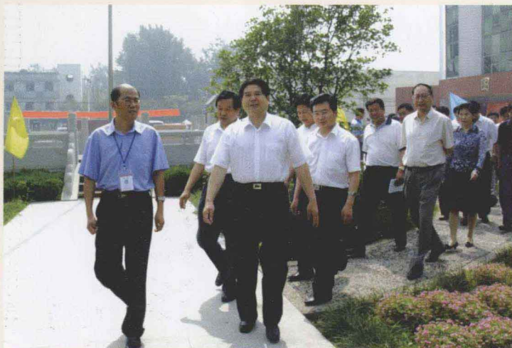
市领导莅临学校视察