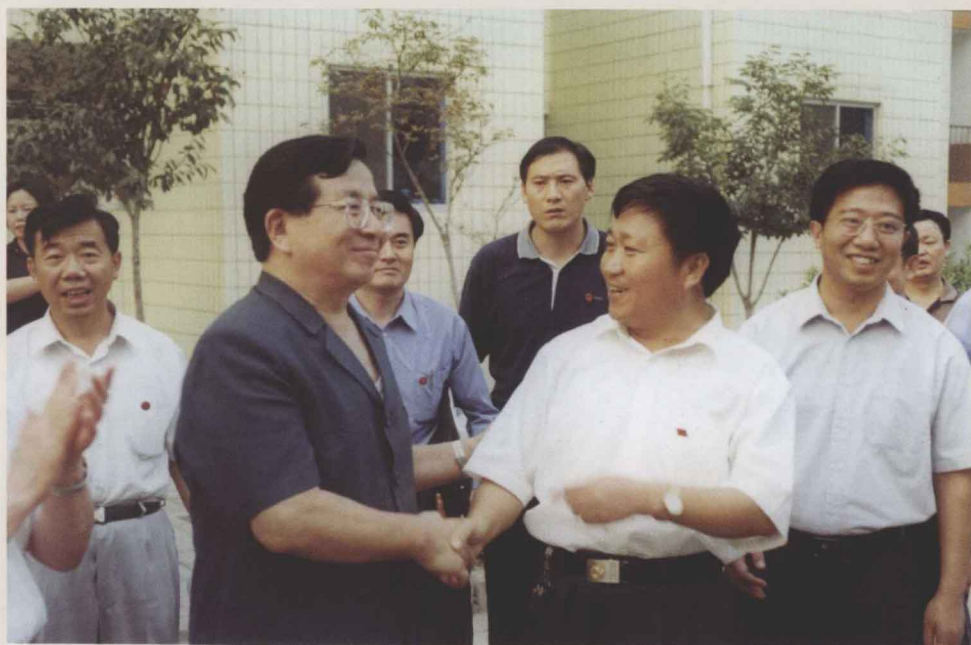
2000年9月17日，中共中央政治局候补委员、中央书记处书记、中组部部长曾庆红（左二）到漯河视察。