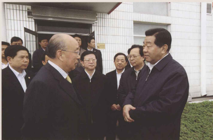
2009年4月19日至20日，中共中央政治局常委、全国政协主席贾庆林（右一）到漯河视察。