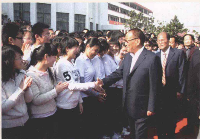
2009年4月回母校时，原中共中央政治局委员、中央军委副主席、国务委员兼国防部长曹刚川上将受到全校师生的热烈欢迎