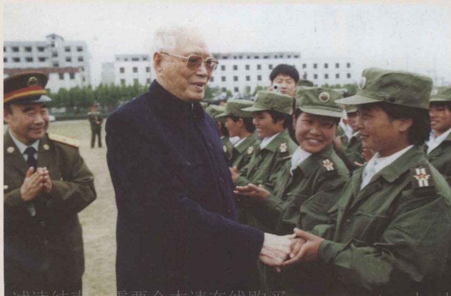
2001年4月24日，原中央军委副主席张震（左二）到南街村视察。