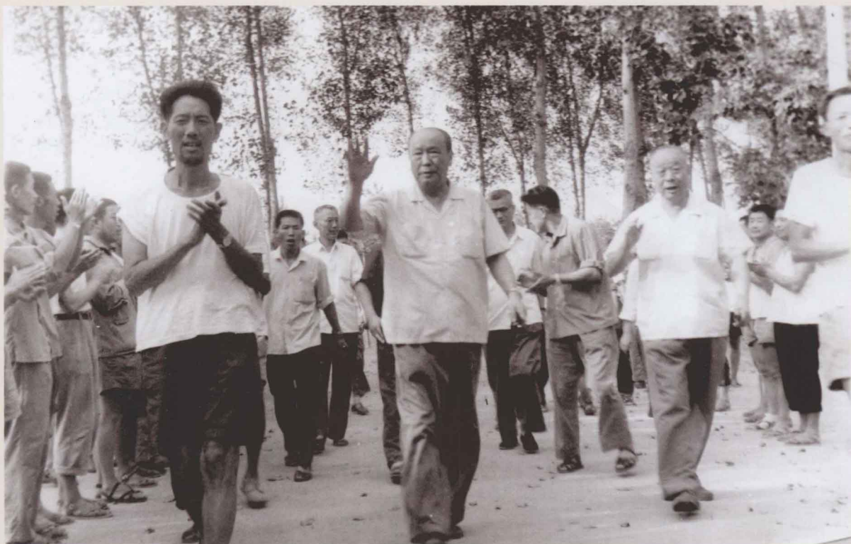
1975年8月，中央慰问团副团长、全国人大常委会副委员长乌兰夫（中）到漯河灾区慰问。