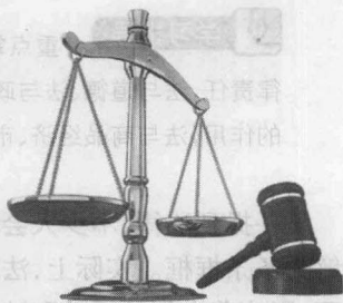
法律代表公平正义

在现代汉语中,“法律”一词有广义和狭义两种用法。广义的法律指法律的整体,以我国当代法律为例,它包括作为根本法的宪法、全国人民代表大会及其常务委员会制定的法律、国务院制定的行政法规、某些地方人民代表大会及其常务委员会制定的地方性法规、国务院部委和某些地方人民政府制定的规章等。狭义的法律仅指专门立法机关制定的规范性法律文件,如我国的全国人民代表大会及其常务委员会制定的法律。