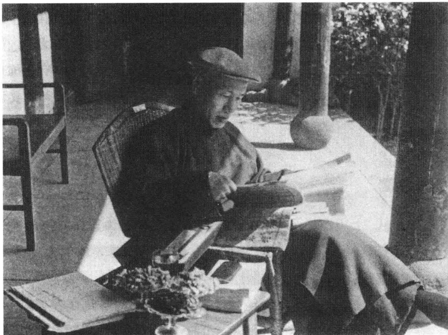
1949 年蒋介石在雪窦寺

经香港“赴美就医”。按照 1948 年国民大会通过的“宪法”第 36 条“总统统率全国陆海空军”的规定,蒋介石下野后仅有的身份是国民党总裁,因为军队国家化的原则无法公开指挥军队,导致军事指挥名不正言不顺。当时滇黔川康渝尚算完整,但大势已去,高层无政府状态加速恶化,大西南的局势也已几乎失控,原来准备在西南建立的复国基地因高官陆续起义而迅速瓦解。滇