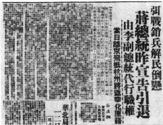
成舍我创办的《世界日报》关于蒋介石下野的报道

后来，被解放军活捉的国民党四川省主席王陵基是这样以现场亲历者回忆蒋介石等人最后离开大陆的那一幕仓皇场景和随行人员的恐惧之色：