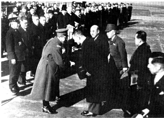
1942年12月20日，汪精衛、周佛海、周隆庠、梅思平等一行抵達東京羽田機場，受到日本首相東條英機及各大臣的歡迎。

仲愷求助。廖仲愷早就欣賞陳公博的才幹，立即回電要求他回國，並推薦其加入了國民黨。廖仲愷與汪精衛協商，委以陳公博國民黨中央黨部書記長的重任。一九二五年，廖仲愷遇刺，陳公博做了國民黨中央農民部長，一時成爲國民黨內炙手可熱的人物。