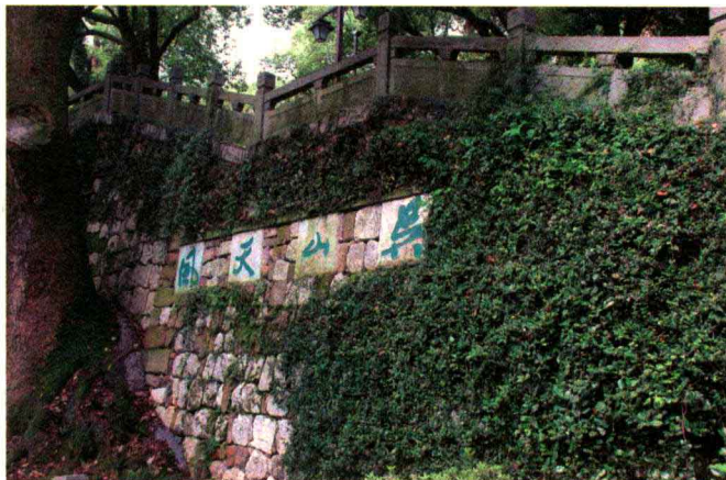
费新我题“吴山天风”