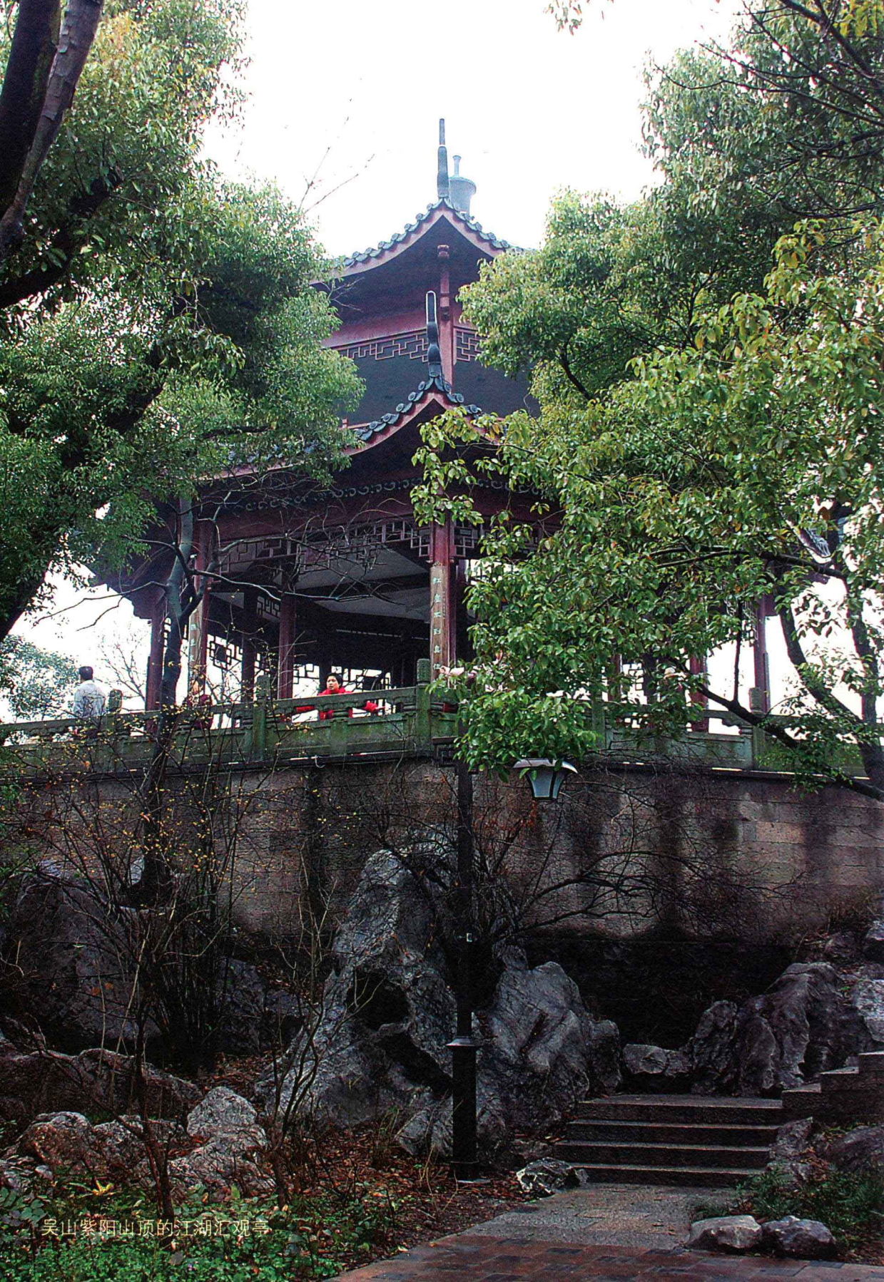
吴山紫阳山顶的江湖汇观亭