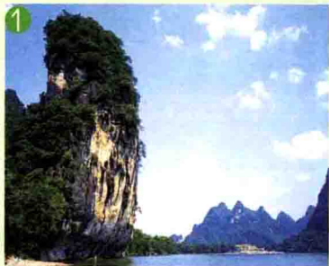
① 朝板山 Chaoiban Mountain