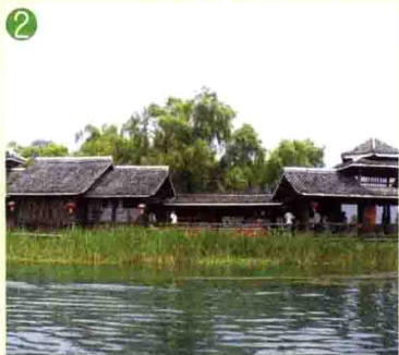
② 世外桃源 Arcadia

词，只有“自然”二字。江面偶见来来去去的渔船，岸边屋顶升起缕缕炊烟，仙境中编织出平凡的生活，人也多了几分祥和与安静。夜幕降临，闪烁耀眼的各色霓虹开始为这幅水墨画描红添色，商铺的灯红酒绿掩盖了周边的青山秀水，醒目的绿、娇滴的黄、浓艳的红、迷离的紫，五彩斑斓。