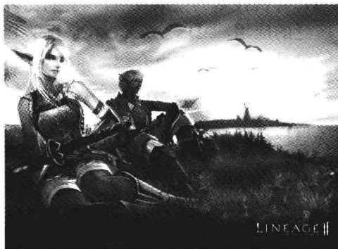
图 1.2 三维游戏场景