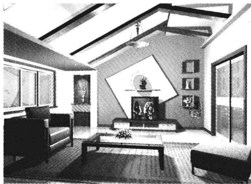
图 1.3 室内设计效果图

三维制作技术在工业产品的辅助设计中已得到广泛的应用，并且起着举足轻重的作用。利用三维软件的造型技术开发设计新产品，比以往手工绘制图纸更准确、形象，更易于调整、修改，如图 1.4 所示。