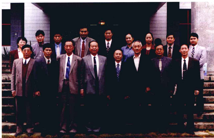
1998年11月28日，课题组主要负责人与部分骨干于深圳大学召开了面向21世纪我国学校体育整体改革与构建科学体系研讨会