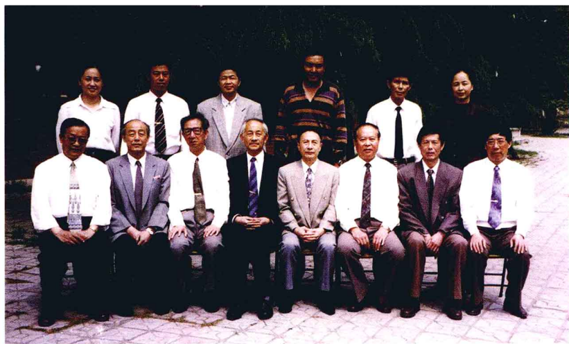
1997年5月2日，课题组在郑州工业大学举行了开题报告