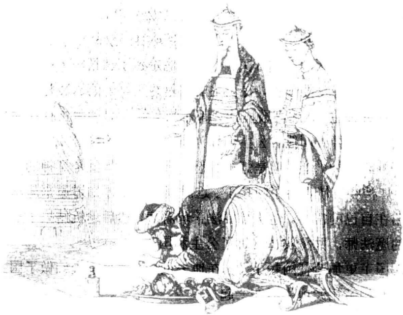
取得了阿拉丁母亲的信任