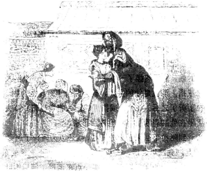
魔法师假装是阿拉丁的叔父