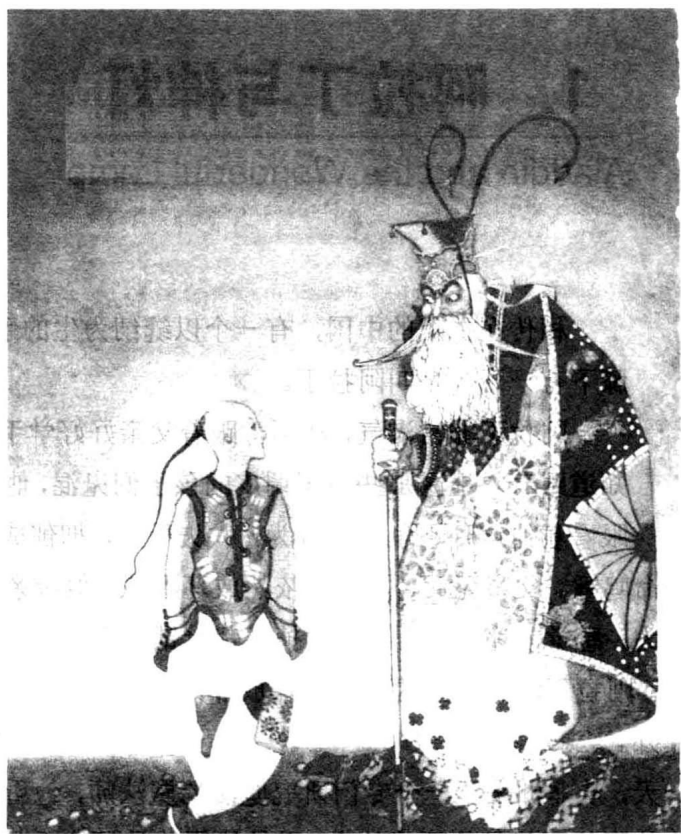
确信阿拉丁是他要找的人