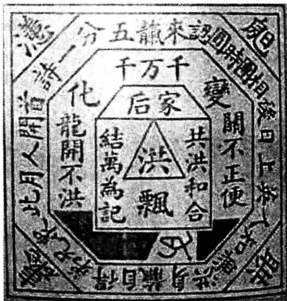
嵌有“洪”字样的天地会通行证

陈近南即陈永华自称。这个解释比较接近实际，后被不少学者接受。因为天地会最初的活动是乾隆五十二年台湾林爽文占据彰化的事实。