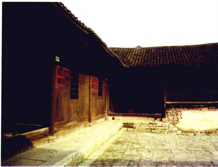
湘鄂川黔省委、省军区机关所在地——永顺县塔卧丁家院子。