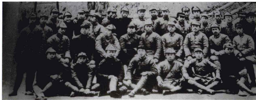
1935年5月，红二、六军团部分团以上干部合影。贺龙（第二排右起第三）、任弼时（第二排右起第二）。