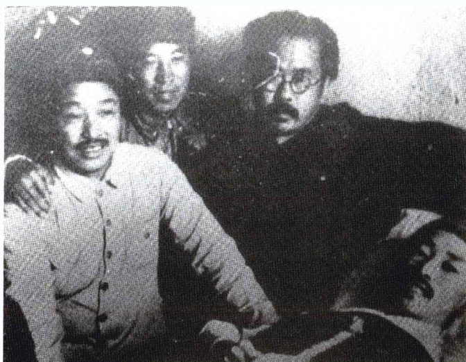
贺龙与任弼时、彭真在延安医院看望亲密战友关向应。