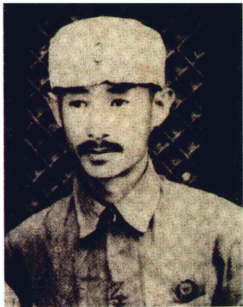
红三军政治委员、 红二军团副政治委员、 红二方面军副政治委员 关向应同志。