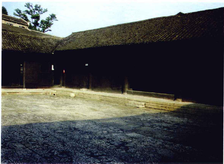
湘鄂川黔省革命委员会机关所在地——永顺县塔卧。