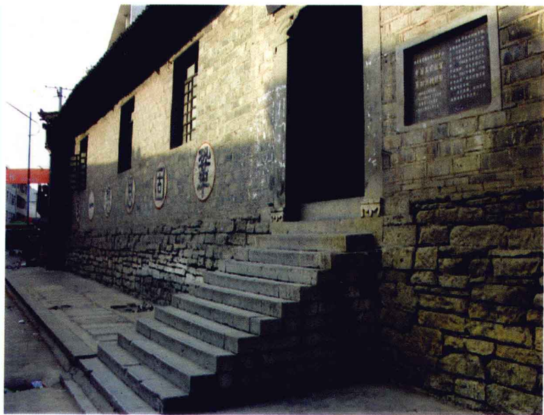
设在永顺县塔卧镇的红军学校第四分校旧址。