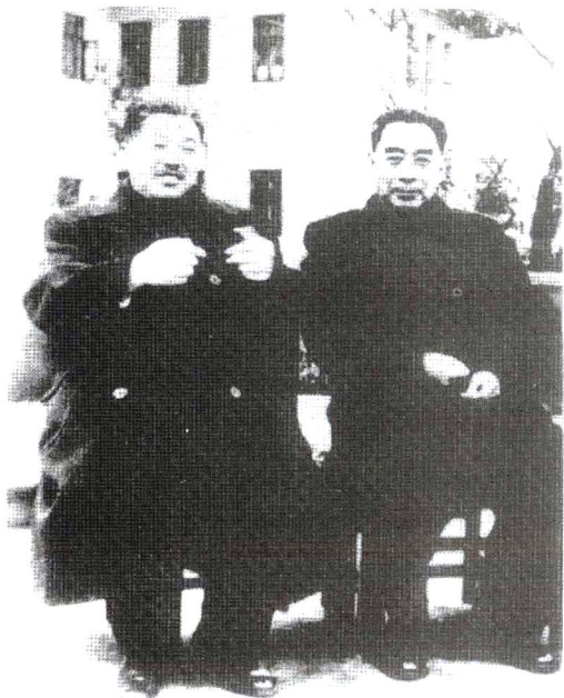
贺龙与周恩来总 理在重庆。