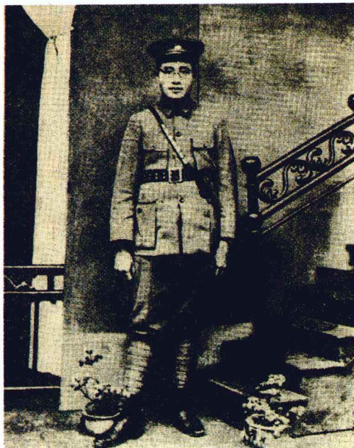
南昌起义时期的 刘伯承同志。