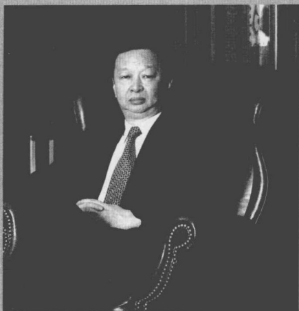
国际围棋联盟主席