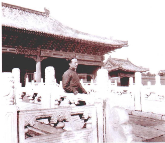
抗战前在北平故宫留影