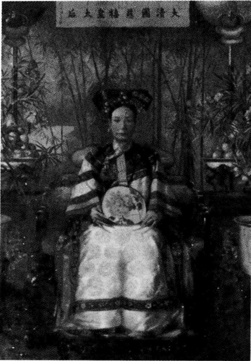
美国女画师卡尔为慈禧所作画像。