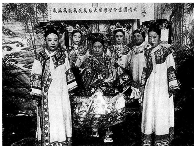
前左起：瑾妃、慈禧太后、隆裕皇后；后左起：本书作者德龄、容龄、德龄母亲。