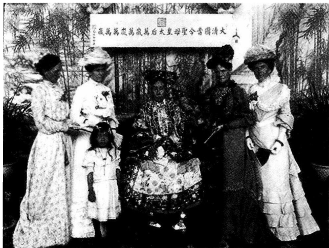
慈禧太后与公使夫人们合影。