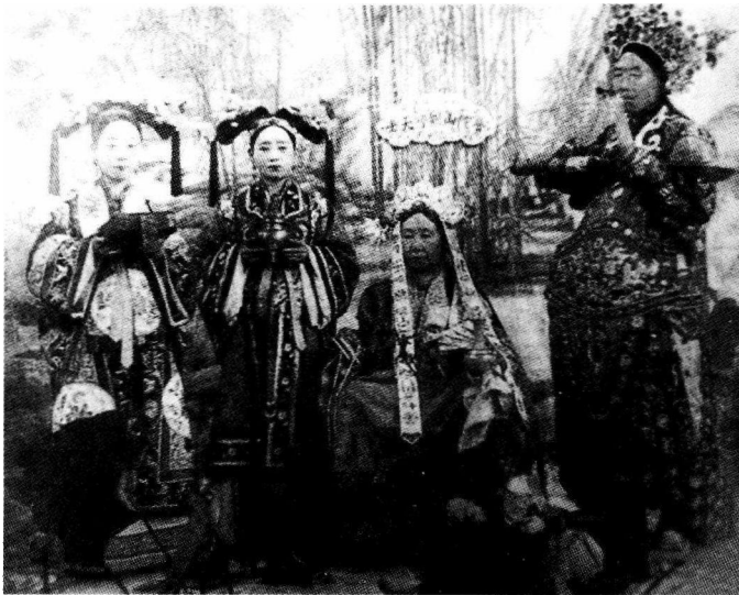
慈禧信奉佛教，这是她扮观音的照片，右边是扮成善财童子的李莲英。