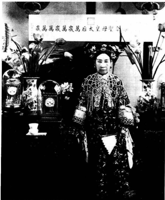
穿着珍珠披肩的慈禧画像。