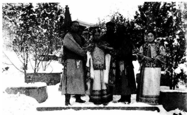
慈禧酷爱照相，这是雪后慈禧留下的照片。