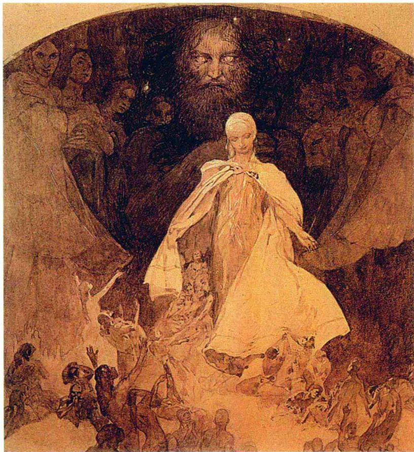
▶▶ [捷克]阿尔丰斯·穆夏,《智慧时代》(Age of Wisdom, Alphonse Mucha, 1936-1938)。