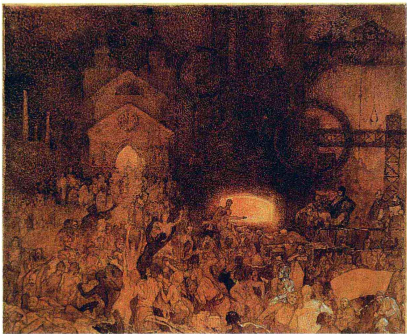
▶▶ [捷克]阿尔丰斯·穆夏,《理性时代》( Age of Reason , Alphonse Mucha, 1936-1938)。