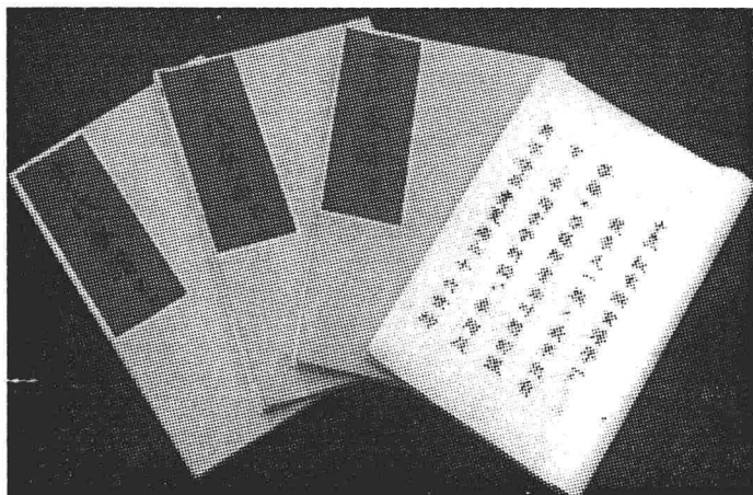
新续修的《李氏家谱》