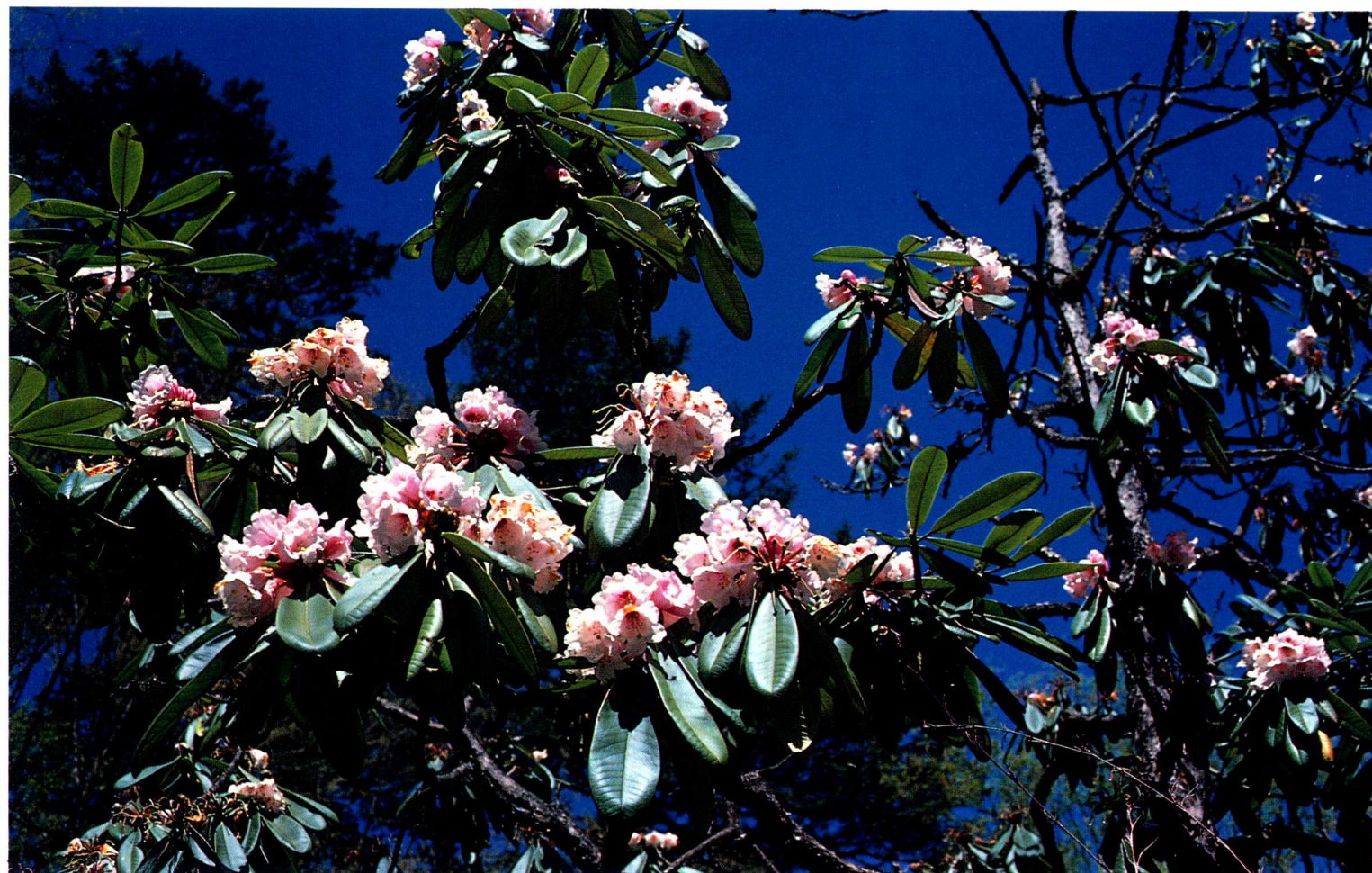
1—4 四川宝兴跷跷, 海拔2 500—2 900米处生于 云南铁杉 Tsuga dumosa (D.Don)Eichler -杜鹃林中的美容杜鹃 R. calophytum Fr. (吕正伟)