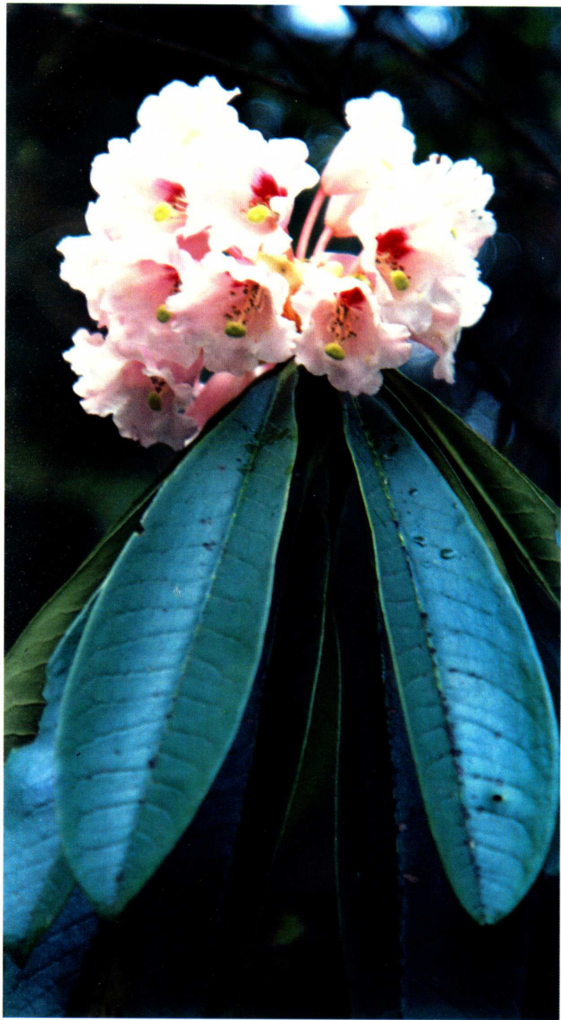
1—1 美容杜鹃 Rhododendron calophytum Fr.