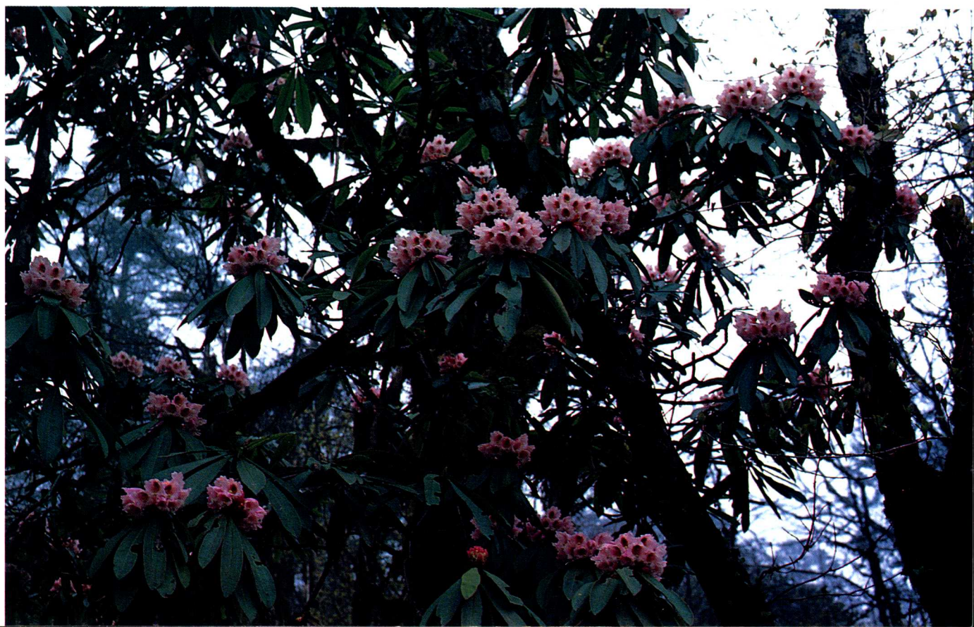
1—5 四川理县后山, 海拔1 600—1 700米阔叶林中 的美容杜鹃 R. calophytum Fr. (吕正伟)