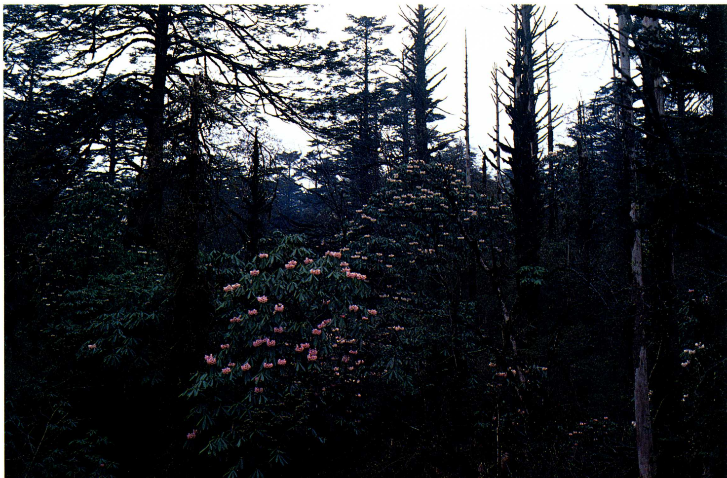
1—7 四川峨眉山雷洞坪, 海拔2 000米处冷杉 Abies fabri (Mast.) Craib. 杜鹃林中的 美容杜鹃 R. calophytum Fr. (杨增宏)