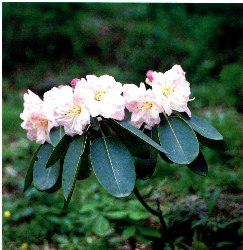
2—1 云锦杜鹃 Rhododendron fortunei Lindl.

产浙江宁波、天台、天目山、龙泉、昌化、瑞安、四明山，安徽黄山，江西庐山、修水、遂川、铅山、武宁、寻乌等地，福建武夷山、崇安黄冈山，湖南桑植、衡山、莽山、宜章、新宁、零陵，广东乳源、乐昌、阳山等地。广西全州、容县、资源、兴安、大苗山、临桂等，贵州威宁，四川康定、南坪等地。生于海拔600—2300米的山坡、沟谷、石山等阔叶林中或灌丛间。