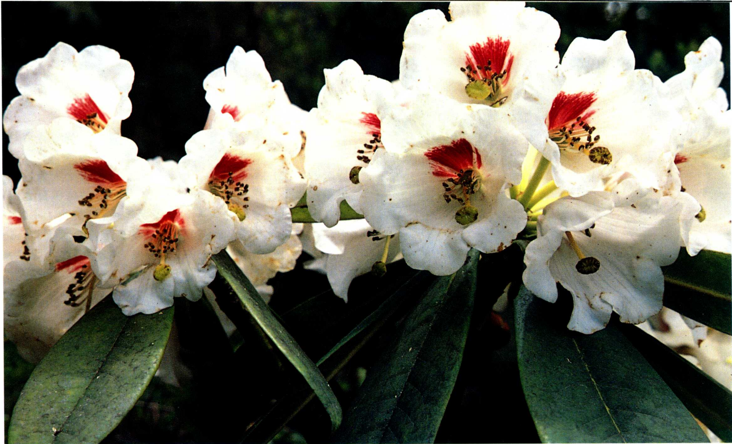
1—2 美容杜鹃 R. calophytum Fr. (杨增宏)