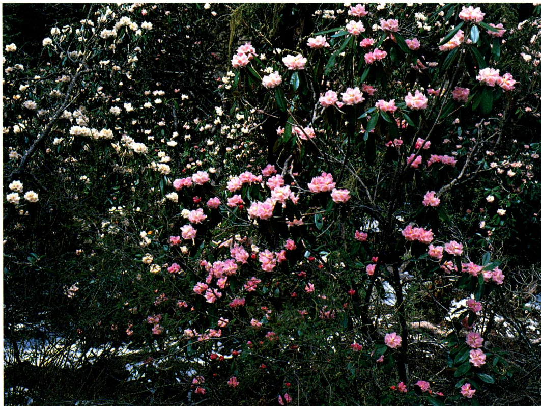
1—6 四川宝兴跷蹊, 海拔2 600米沟旁的美容杜鹃 R. calophytum Fr. (吕正伟)