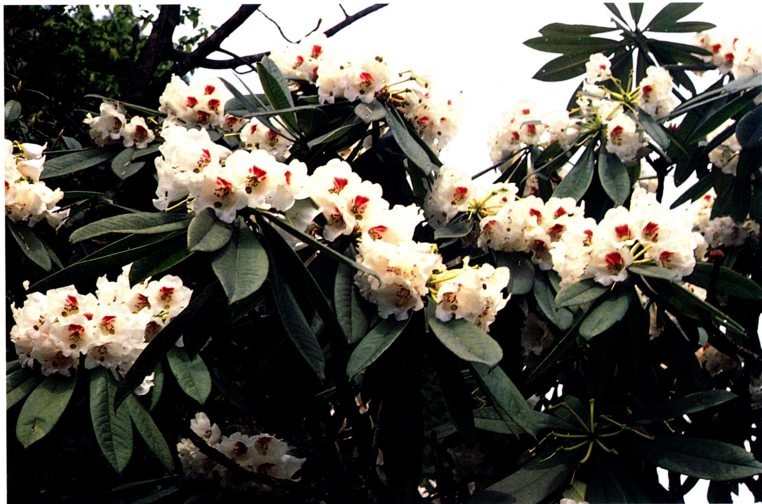
1—3 云南东北部彝良小草坝，海拔1750—1900米山坡沟旁阔叶林中的美容杜鹃 R. calophytum Fr. (杨增宏)