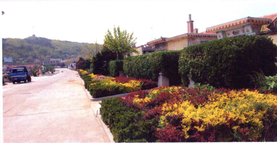
岛上渔村一角(小钦岛花园式渔村)