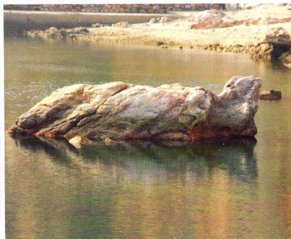
石龟望天(南长山岛仙境源景区)