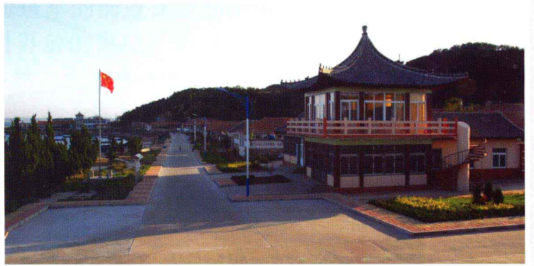
岛上渔村一角(庙岛村)