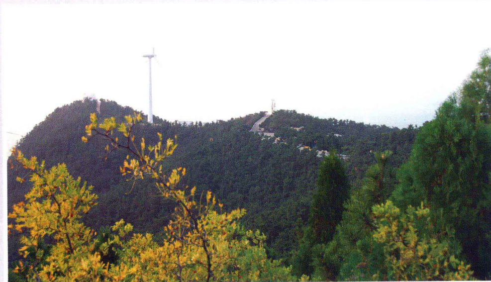
长岛林海(南长山岛)