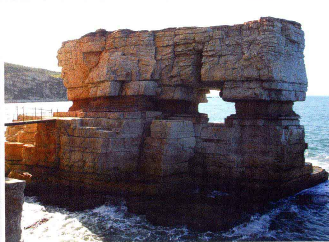
石楼(凯旋门)(大黑山岛)