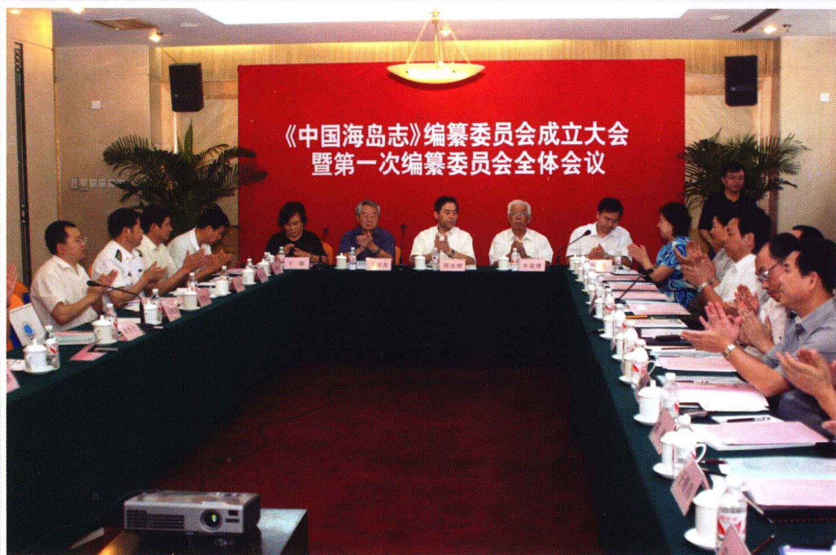
《中国海岛志》编纂委员会成立大会会议现场