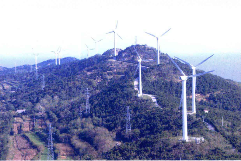
风能开发(南长山岛)