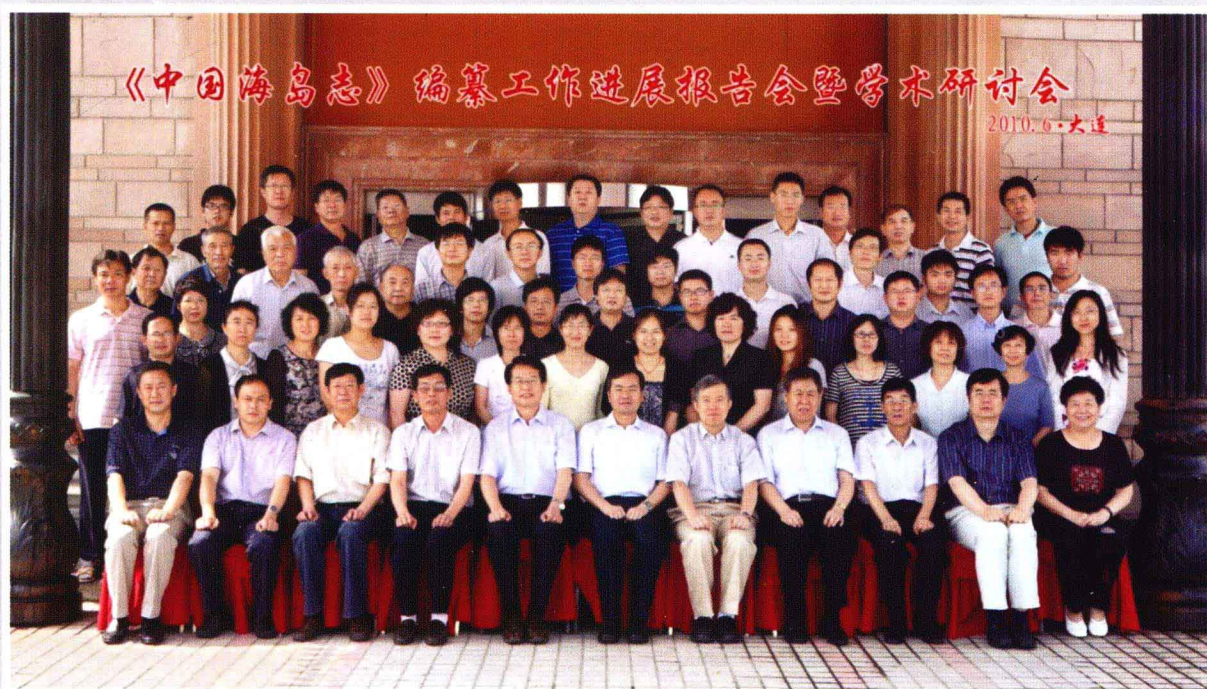
《中国海岛志》编纂工作进展报告会暨学术研讨会与会人员