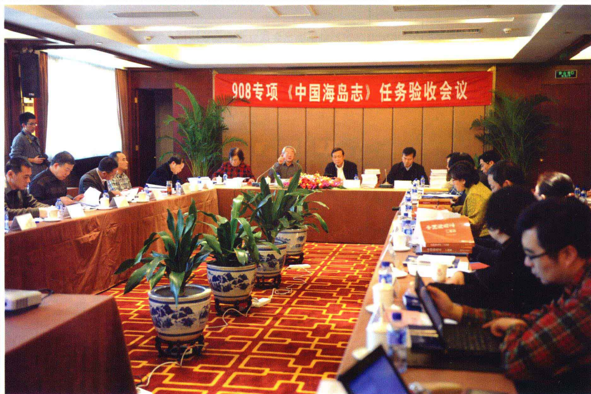
《中国海岛志》验收会议现场