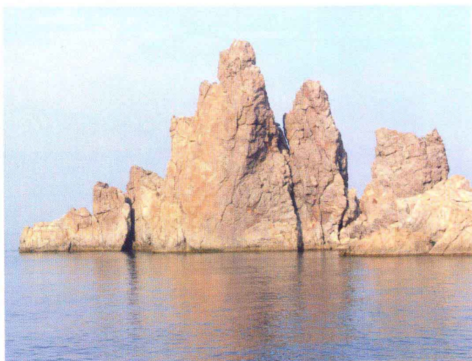
天然景观——观音礁(北隍城岛大尖礁)