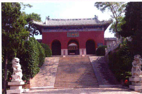
庙岛显应宫(全球唯一妈祖官庙)