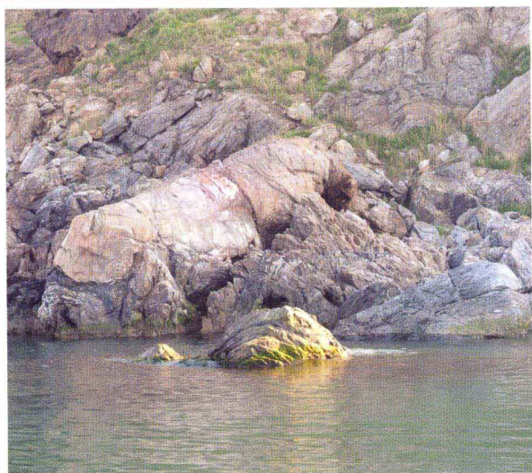
天然奇石——虾石(砣矶岛)