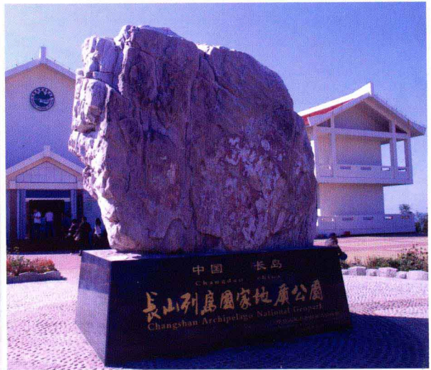
国家地质公园陈列馆(南长山岛望福礁景区)