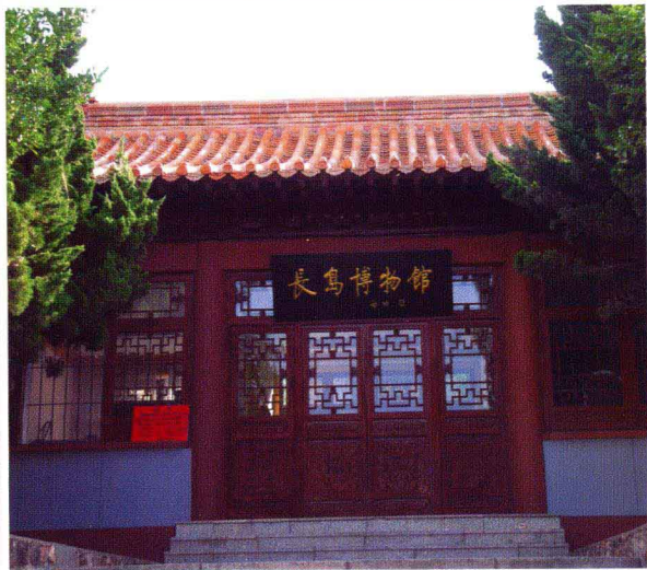
长岛博物馆(南长山岛)