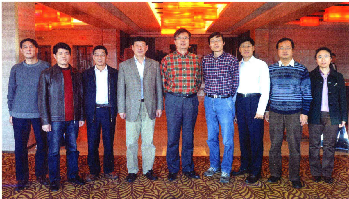
《中国海岛志》总编纂组成员