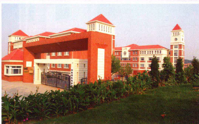
岛上学校(长岛中学)