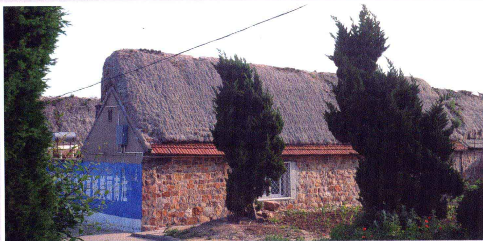
岛上渔村一角(大黑山岛南庄海草房)