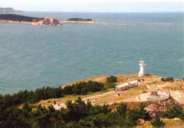
珍珠门(水道、灯塔、文化遗址)