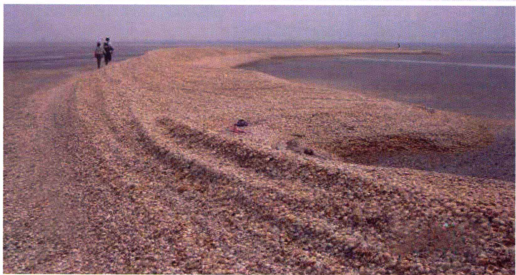
贝壳堤岛(飞雁滩贝壳堤)