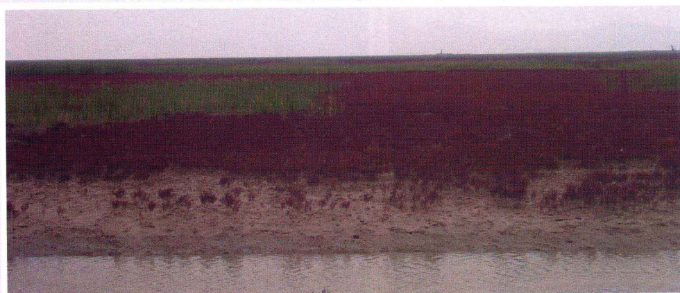
碱蓬芦苇群落景观(黄河入海口)