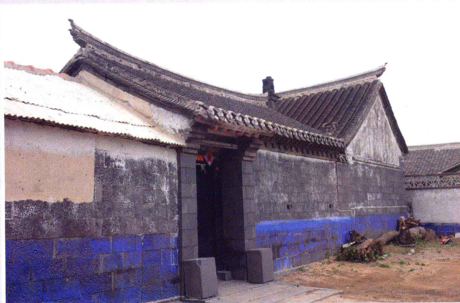
岛上渔村一角(桑岛老宅院)