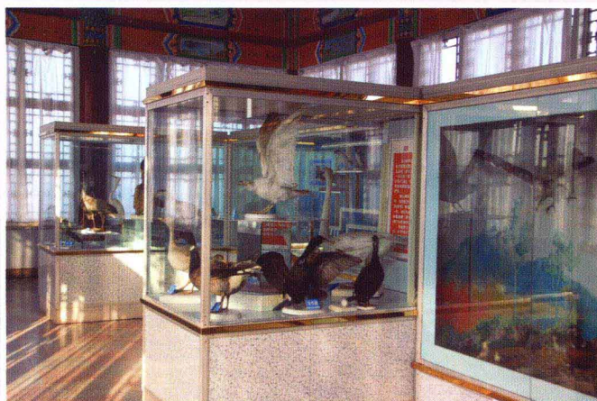
长岛鸟展馆(南长山岛峰山)