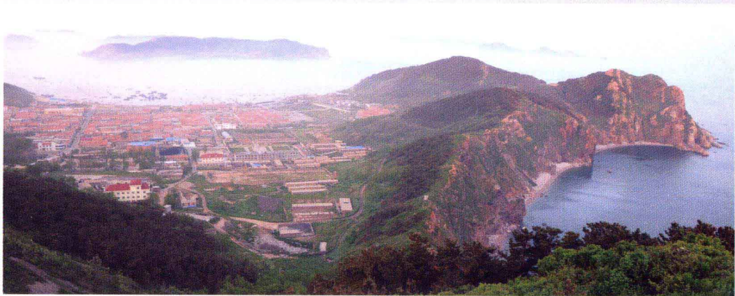
海上仙山——长岛(庙岛群岛北部岛群)