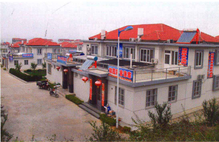
岛上渔村一角(南长山岛黑石嘴村)