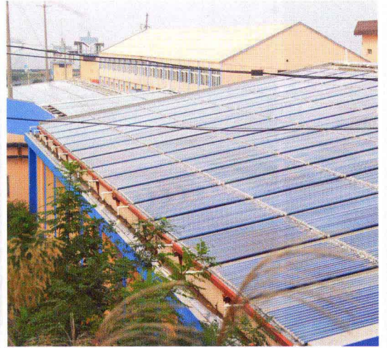
太阳能利用(南长山岛北城村)