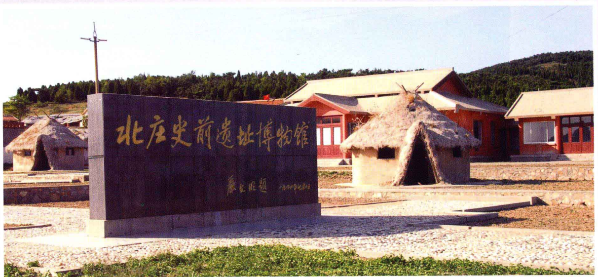
东半坡——北庄史前遗址(大黑山岛)