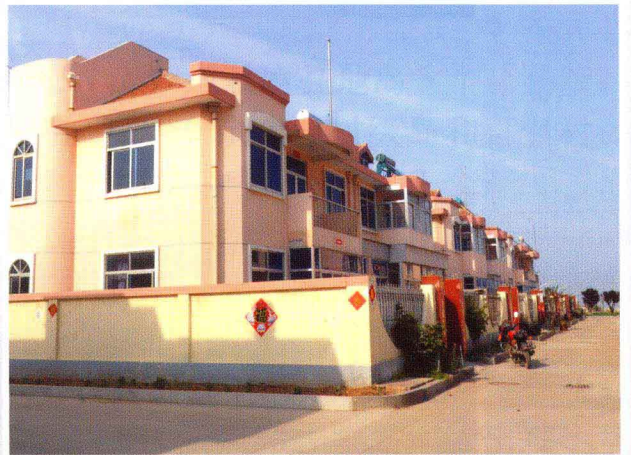
岛上渔村一角(南隍城岛现代化渔村)