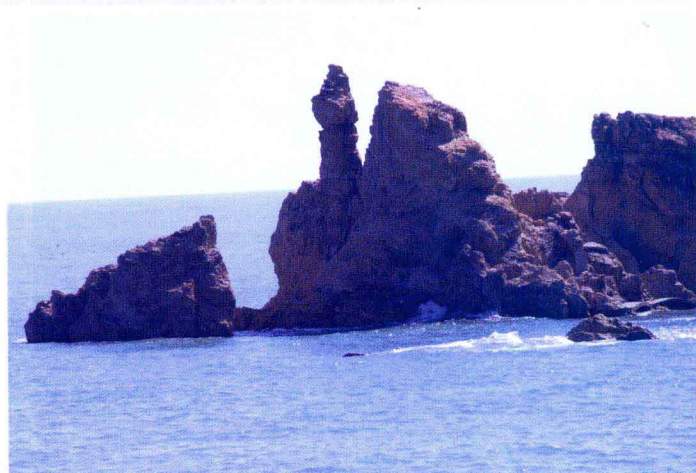
天然景观——望夫石(南长山岛望福礁景区)