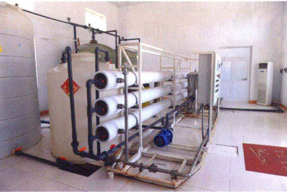
岛上海水淡化(砣矶岛供水中心)