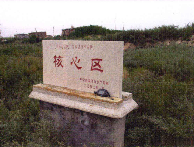
贝壳堤保护区(无棣县)