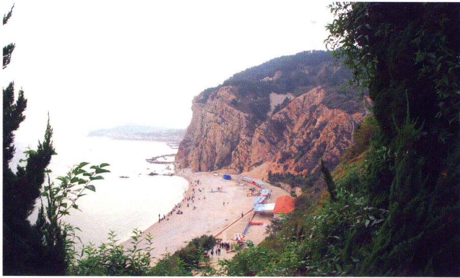
仙境源景区一角(南长山岛)