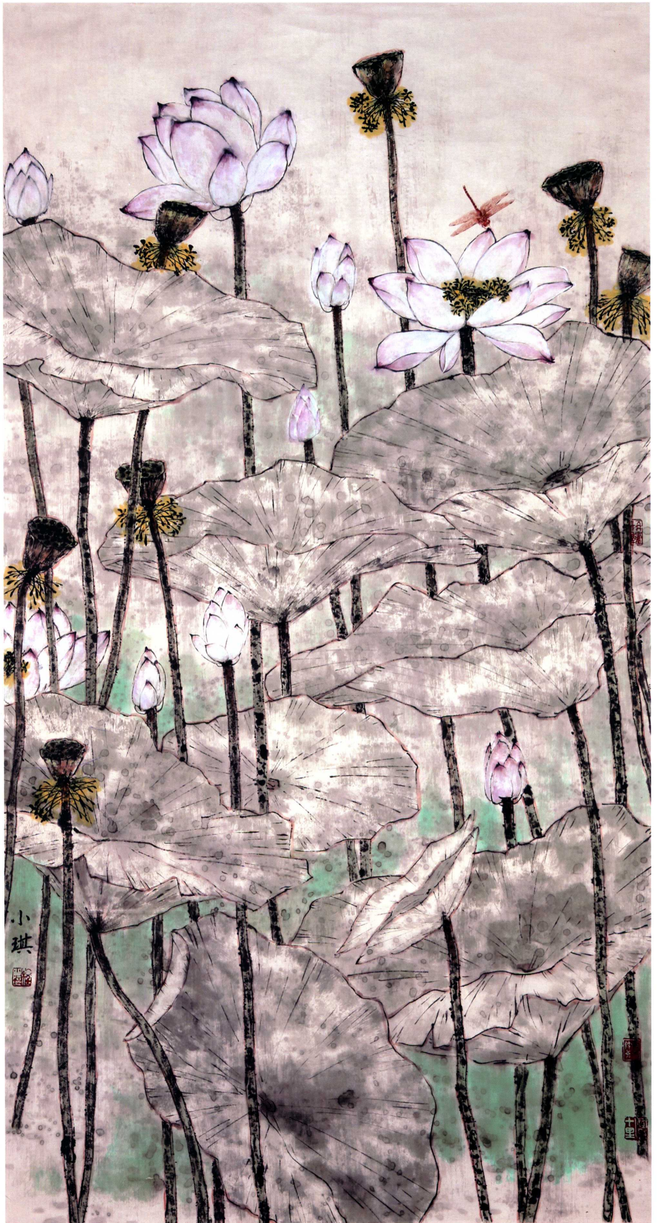
莲华清影 180cm × 98cm 纸本设色 2011年