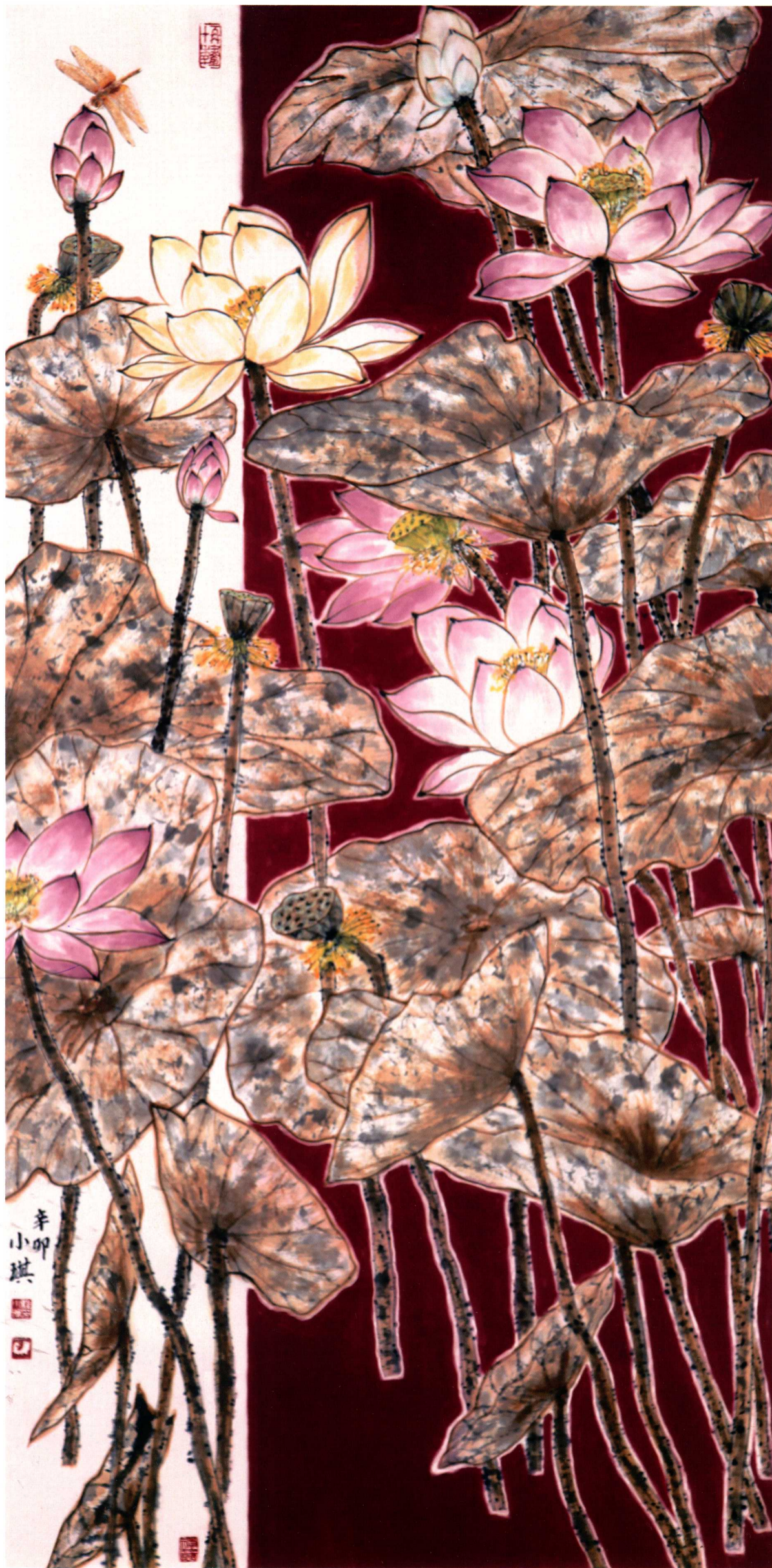
吉祥 136cm × 68cm 纸本设色 2011年