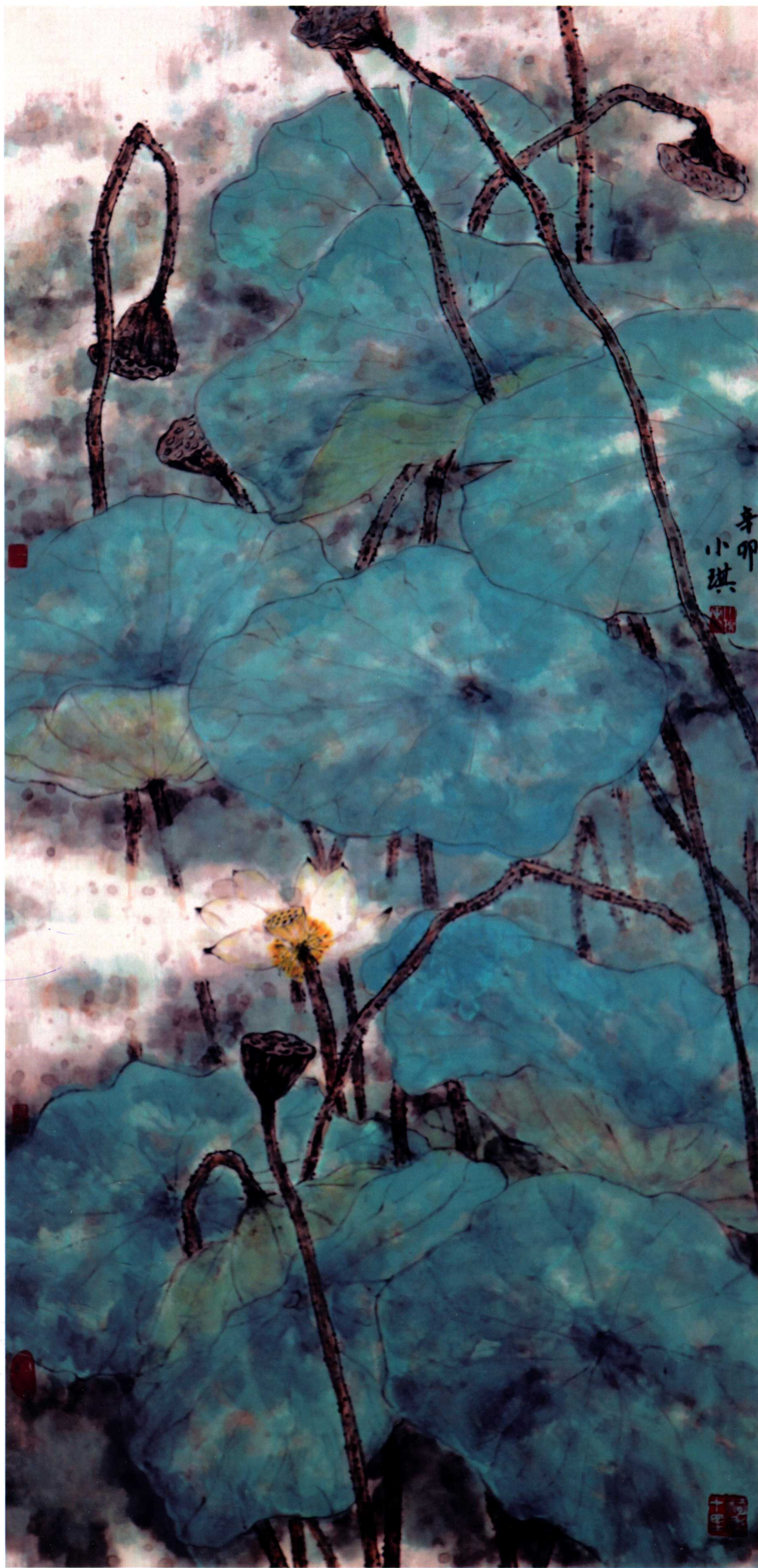
青盖亭亭 136cm x 68cm 纸本设色 2011年