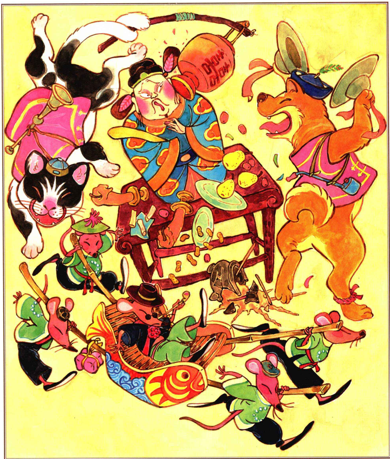
红眼绿鼻子·小红孩