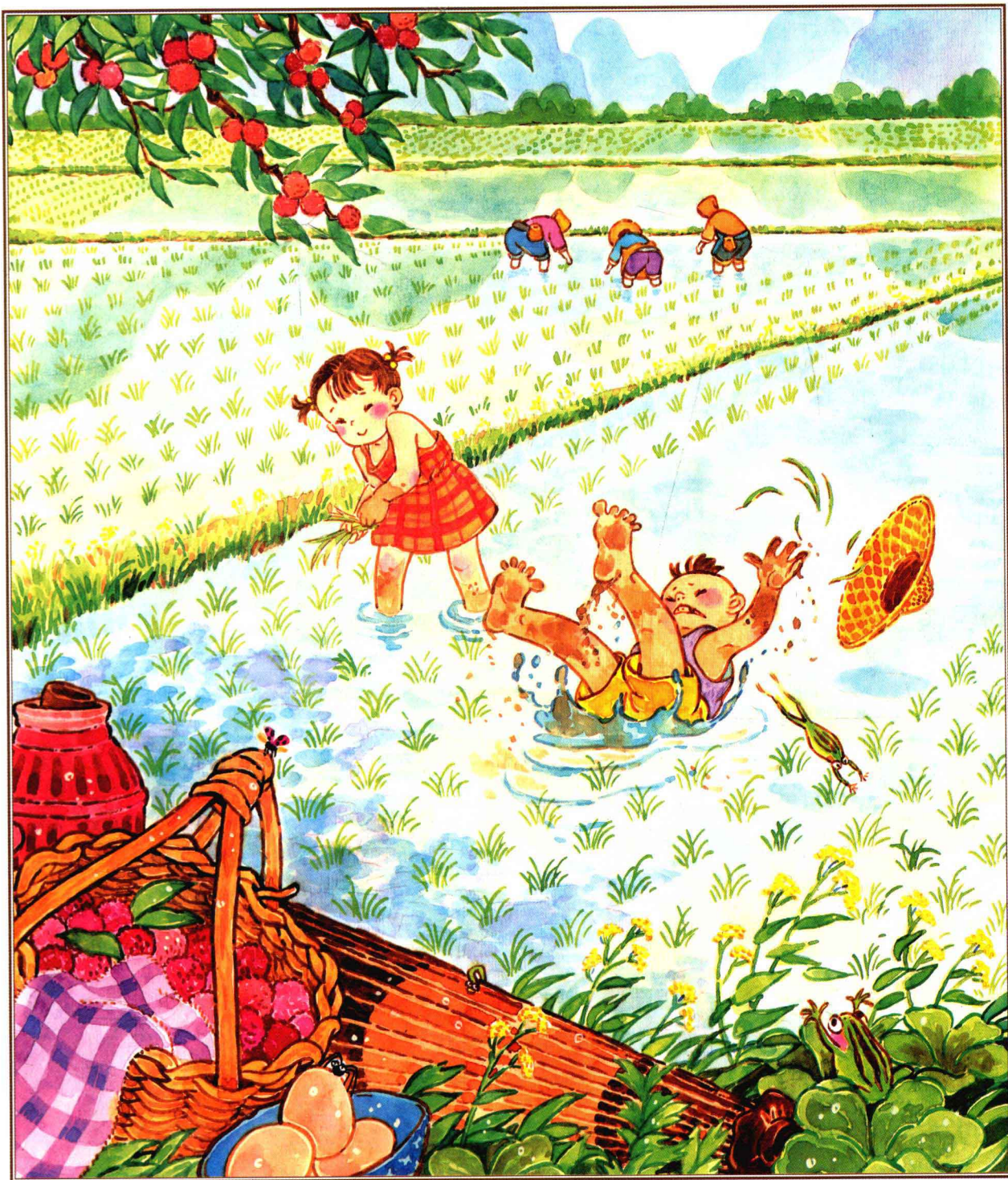
红眼绿鼻子·栽黄秧