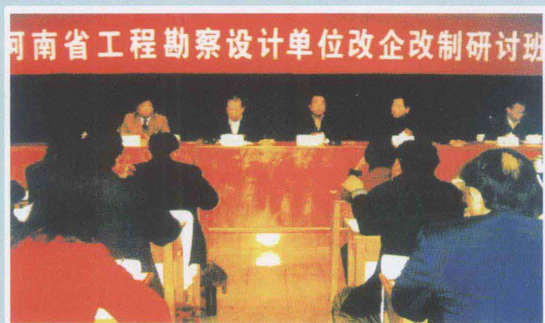
◀ 2004年3月22日至24日，协会举办全省工程勘察设计单位改企改制研讨班。中国勘察设计协会时任理事长吴奕良先生亲临河南讲学，在研讨班上作了体改专题报告。图为吴奕良（正中）、省发改委副主任范保国（左二）在研讨班主席台就座。