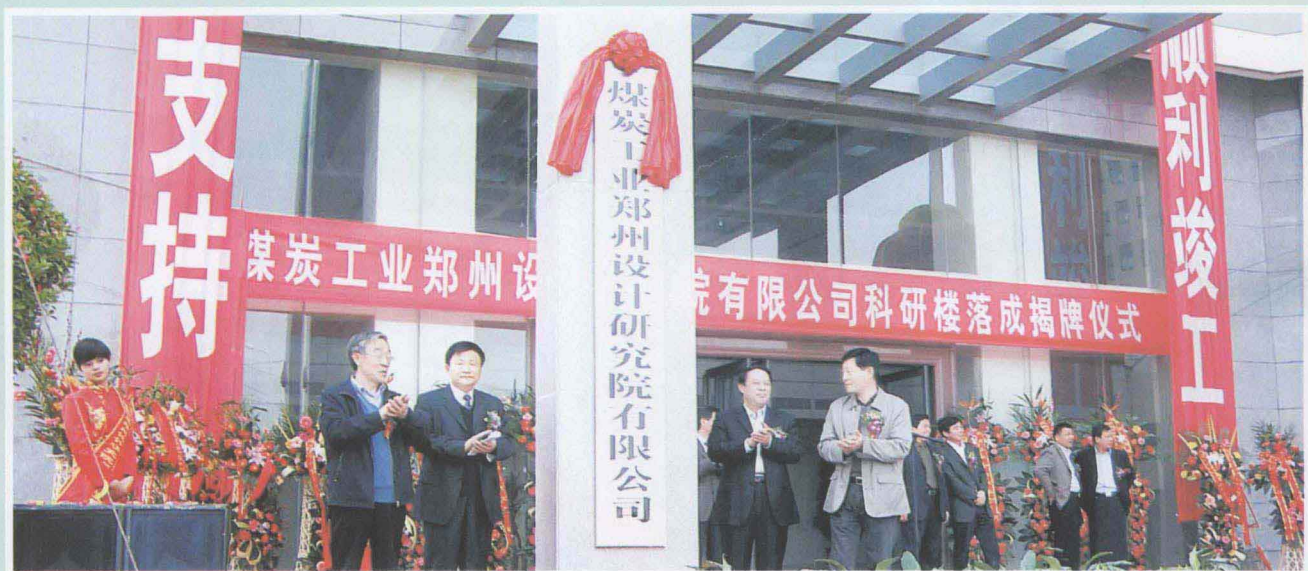
▲ 煤炭工业郑州设计研究院有限公司举办公司科研楼落成暨公司揭牌仪式。