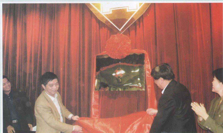
▶ 河南省建筑设计研究院，是省建设厅改革试点单位，也是省直较好完成改制单位之一。图为该院举办新公司揭牌仪式。