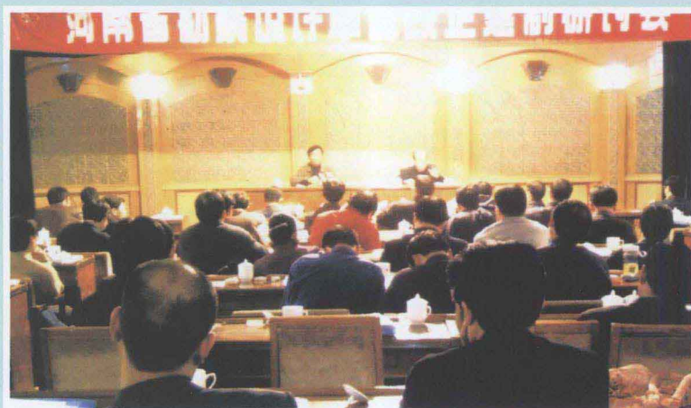
▶ 2003年11月10日至12日，协会在焦作市举办工程勘察设计单位改企改制研讨会。协会思想政治工作委员会、经营管理委员会、财会专业委员会、勘察专业委员会成员单位有关人员参加了研讨。省水利、化工、交通、电力、中机十院、中讯邮电、洛阳石化、平顶山选煤院、黄委设计院以及南阳水利院等交流了改企改制的思路和经营管理工作经验。