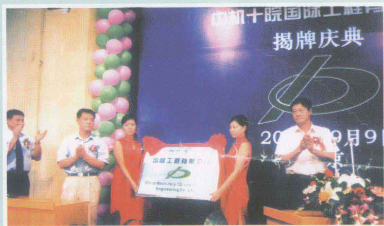
◀ 中机十院国际工程有限公司 举行公司揭牌仪式。