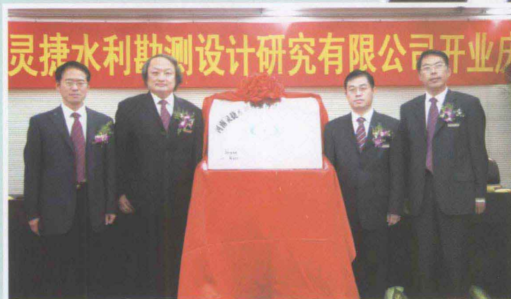
◀ 河南灵捷水利勘测设计研究 有限公司举行开业仪式。