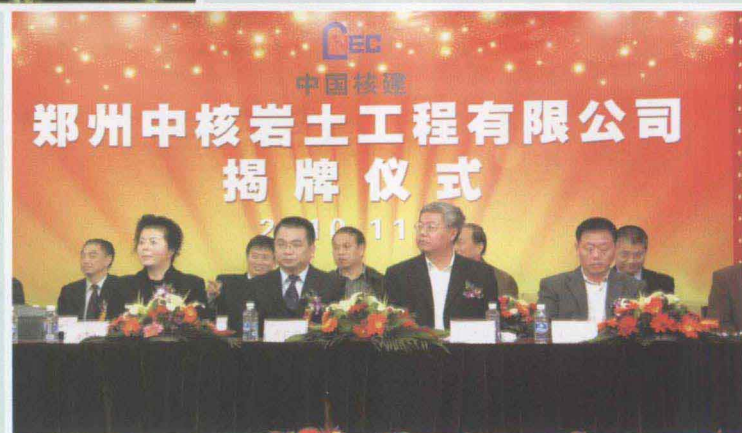
▶ 郑州中核岩土工程有限公司 举行公司揭牌仪式。