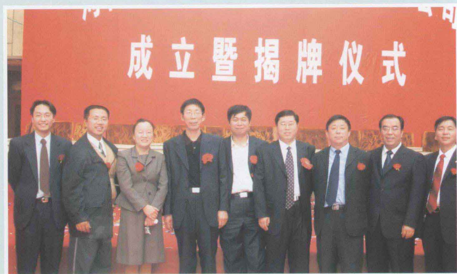
◀ 河南省水利勘测设计院，是省水利厅改革试点单位，是省直最早完成改制单位。图为公司董事会、监事会成员在新公司成立暨揭牌仪式上留影。