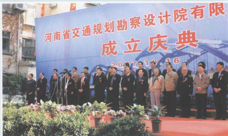
◀ 河南省交通规划勘察设计院有限责任公司举办成立庆典大会。