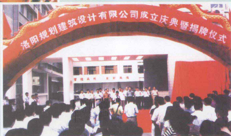
▶ 洛阳规划建筑设计有限公司 举行公司成立庆典暨揭牌仪式。