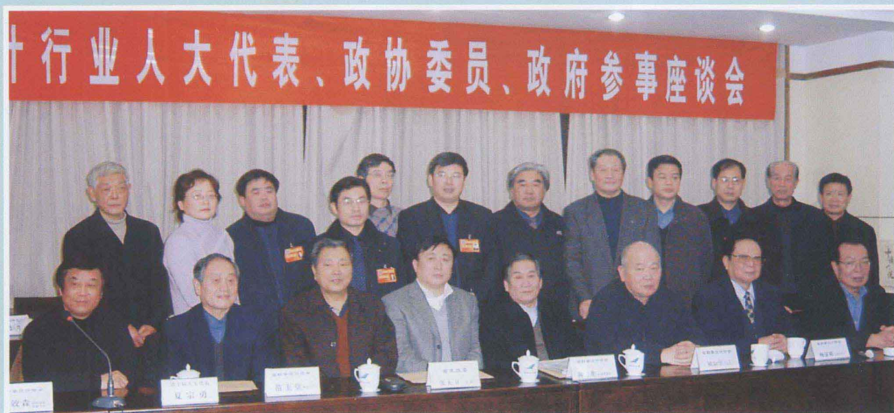
▲ 河南省勘察设计协会每年在省召开人大、政协会议期间，都要召开行业人大代表、政协委员、政府参事座谈会。通报行业情况和协会工作，并就行业体制改革问题，以人大代表、政协委员的名义向“两会”提出建议、提案，推动行业体制改革。图为2006年1月14日协会召开的有副省长张大卫（左四）、省人大常委会原常务副主任 钟力生 （右四）、省政协原常务副主席姚如学（右三）参加的座谈会，会后有关领导与代表、委员、参事等合影。