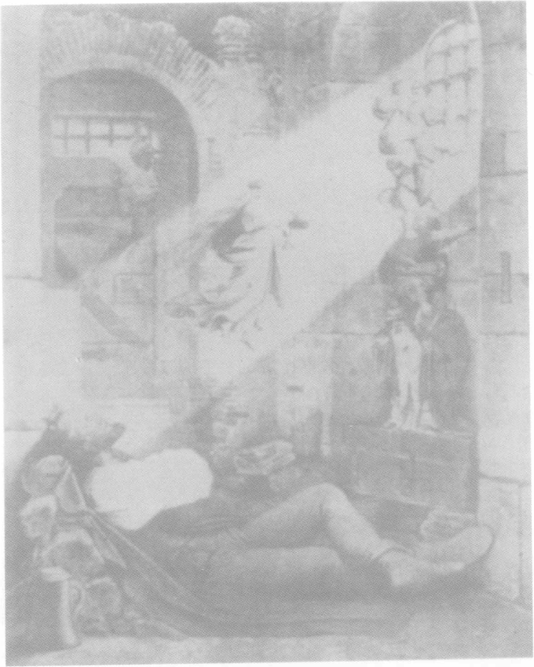
施温德作《囚犯的梦》