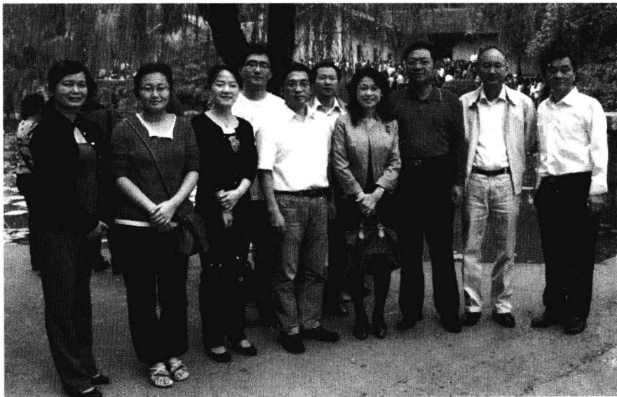
调研组在改造后的韶山毛泽东同志故居

其次，注重发挥历史遗迹的现实教育作用，丰富社会主义核心价值体系建设的载体。结合爱国主义教育示范基地“一号工程”的建设，湖南省首先加大了对韶山的建设和保护。他们改扩建了毛泽东广场、新建了毛泽东遗物馆，修通了韶山高速公路和核心景区的南北两条绕行公路，修建了四个停车坪，进行了配套设施的建设和改造，整治了景区周边环境。韶山“一号工程”于2009年8月