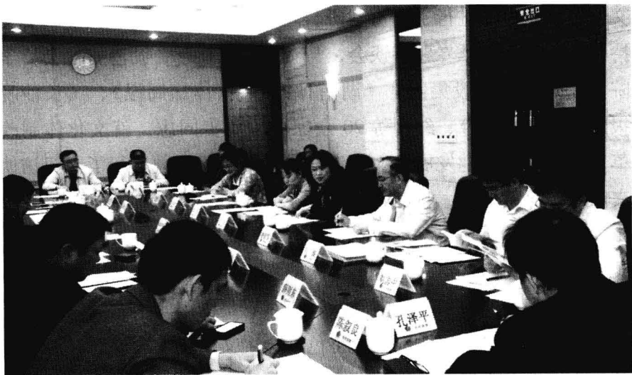
2011年9月22日，调研组在湖南长沙召开湖南省文化改革发展座谈会

第一，湖南的文化发展体现出明显的“经济小文化大”的特点。湖南属于我国中部地区，经济发展居全国中上游水平，但是，湖南文化的发展却走在了全国前列。据有关部门统计，“十一五”结束之时，文化产业占GDP的比例达到5%的，全国只有北京、上海、广东、湖南和云南。在这些省市当中，湖南的经济发展水平赶不上北京、上海和广东，而云南独特的民族和历史、地理、文化资源，也是包括湖南在内的其他省份所没有的。就是在这样的基础