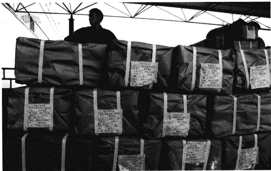
中南出版集团发往甘肃农家书屋的专供图书

一是加强公共服务体系建设。湖南这几年建设了湖南省博物馆改扩建工程、湖南图书馆改扩建工程、湖南文化艺术中心等一系列标志性文化设施。同时，他们把文化设施建设的目标盯住乡镇，2010年完成了1024个乡镇文化站的建设，2011年又将完成最后一批1058个建设项目。建成农家书屋2万家。为基层配备流动舞台车131台、新华汽车书店100台、农村电影放映设备1727套、流动放映车88台。乡镇文化站的建设大大提升了乡村文化服务水平，有效缓解了文化发展的城乡不平衡性。