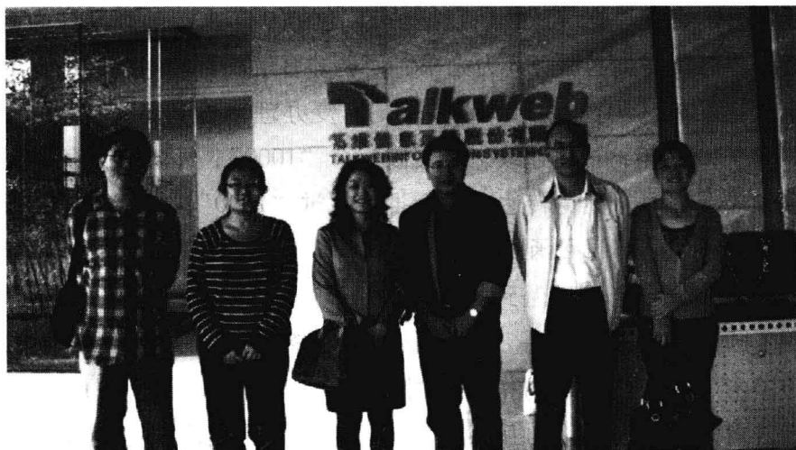
调研组走访拓维公司

再次，以新的技术手段开发红色资源，在建设社会主义核心价值体系中体现时代性。创意文化产业是文化发展的朝阳产业。湖南省的创意文化产业在兴起、发展的过程中，对社会主义核心价值体系的弘扬，也有着高度的自觉意识。如成立于 1996 年的拓维信息系统股份有限公司，就利用自己遍及全国 28 个省市的分支机构及网络平台，不仅着力推动中国原创动漫事业的发展，而且勇于承担