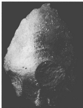
砍砸器 (周口店出土)

北京人所处的时代，在人类经济文化史上属于旧石器时代初期。他们的石器是用原始的打制方法制成的，技术还不大熟练。他们在附近的河滩上选取石英岩、绿色沙岩、火石等作原料，做成各种形状的石器，最大的是厚刃砍伐器，较小的有双刃尖状器，还有刃部锋利的刮削器和两端刃器等。这些工具分别用于砍伐树木、刮削兽皮和切割兽肉，同时也用作狩猎的武器。北京人在辛勤劳动和艰苦斗争中不断获得进步。