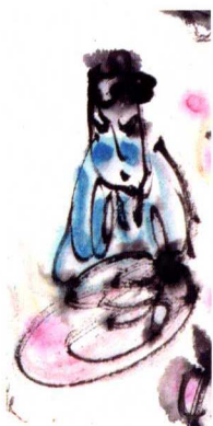
阿弥陀佛！ 保佑附我的这些小神仙安康！