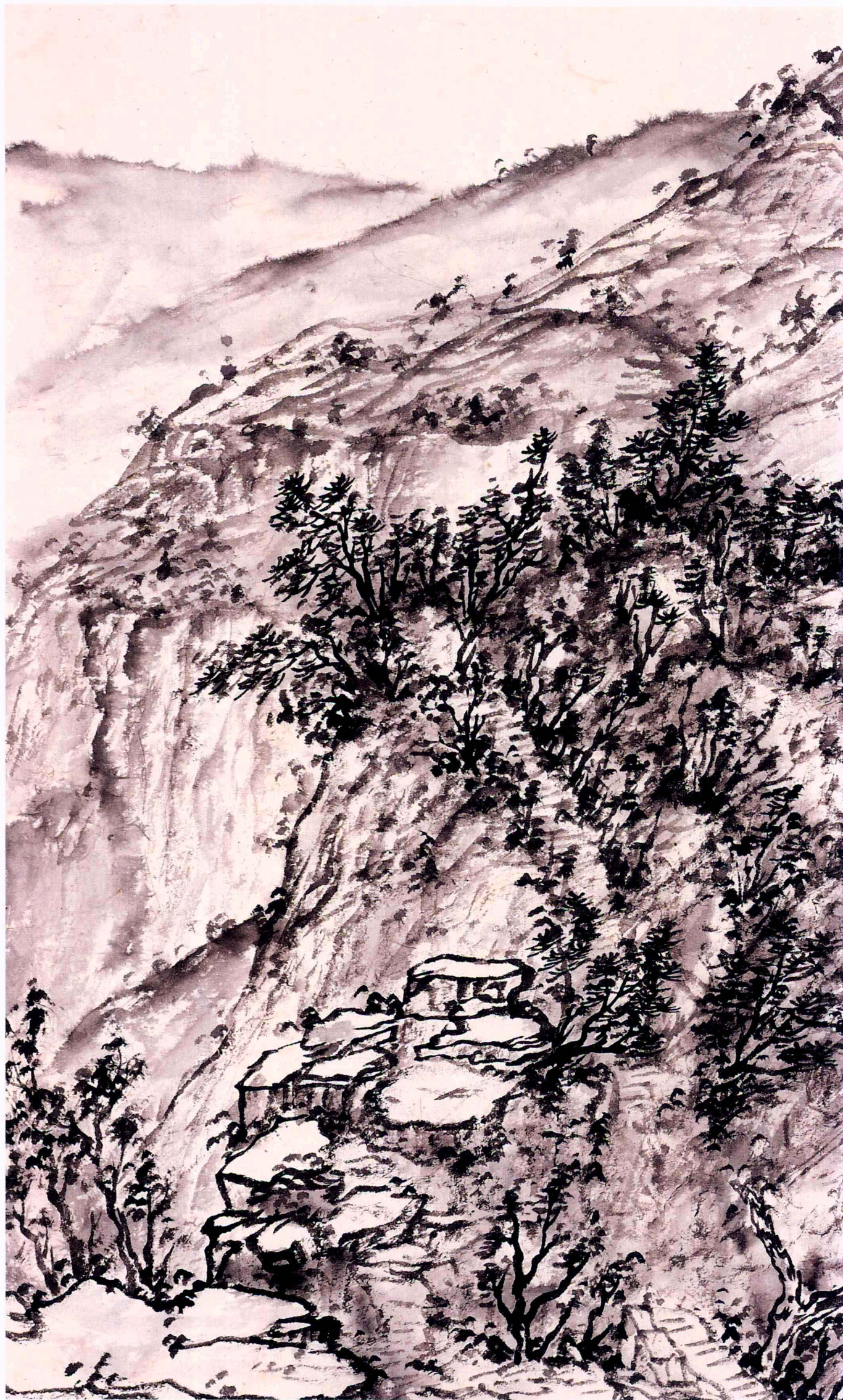
神农山写生图之一