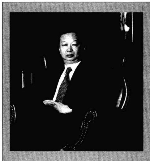
国际围棋联盟主席