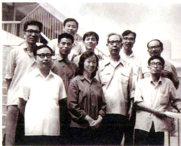
1980年与首批研究生合影