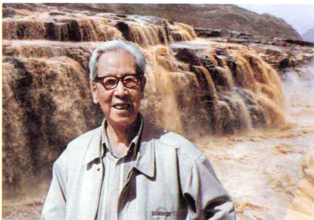
1998年在黄河壶口瀑布前