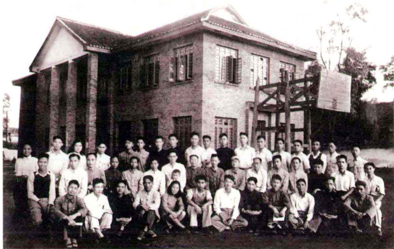
1950年贵阳师院国文系师生合影