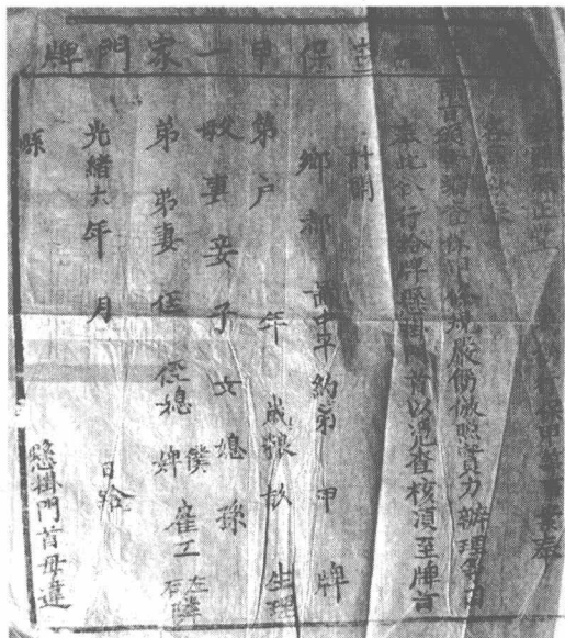
(清) 婺源 保甲門牌