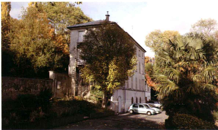
法国摄影博物馆外景

对于我们中国人来说，这些最古老的照片有着特殊的历史意义。因为中国人都希望看到我们中国最早的影像，这是很自然的事情，就像一个家庭希望看到自己的老祖先照片一样。在法