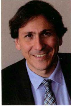
埃松省议会主席 杰罗姆·戈德杰