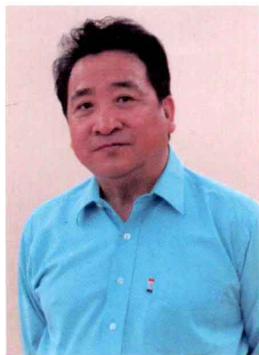
姜昆 中国文学艺术基金会秘书长