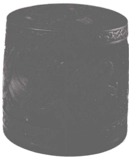
(a) 海水游龙纹剔红漆盒(清代)

(2) 平面用于立体的图案。指附着于立体载体的表面装饰,如服饰、建筑、各类器皿上的图案等。它是平面与立体的结合,是三维的呈现(图1-1-2)。