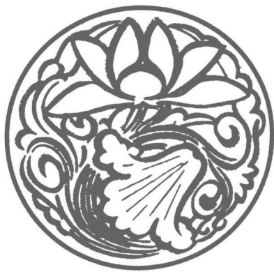
(b) 写意类(瓷器图案,宋代)