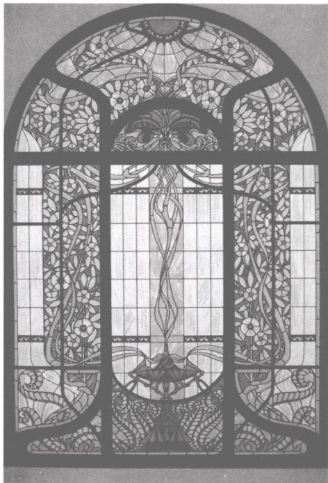
图1-1-1 平面图案（彩绘玻璃，19世纪早期，德国）

（1）平面图案。指附着于平面载体的图案，它的表现形式是二维的，如纺织、印染、印刷、封面、插图、壁画等图案都属平面图案（图1-1-1）。