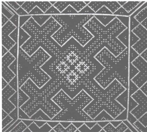
(a) 几何类(壮锦,现代,广西)

(2) 抽象图案。即由非具象形象组成的图案,它可分为几何形与随意形两类。几何形图案即运用规矩的点、线、面以及各类几何形组合成的图案,其构成形式呈明显的规律性或具有严格的几何骨架;随意形图案即以不规则的点、线、面或自然形象的分解重构,或以一些偶然形随意组合而成的具有审美价值的图案(图1-1-5)。