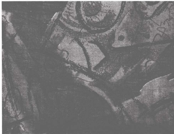
(b) 随意类(印花布,当代,北京)