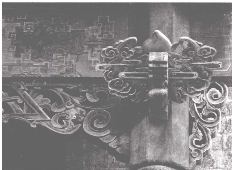
图1-1-3 立体图案(传统民居结构装饰,山西)

(3) 立体图案。即图案自身具有立体的属性,其表现形式是三维的,如各种装饰雕刻,门窗、围栏的装饰,器物、家具的装饰部件等都属立体图案的范畴(图1-1-3)。