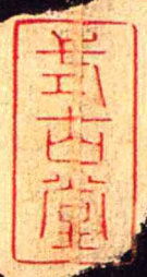
畫眠夕寐籃筍象床弦歌酒讌接杯