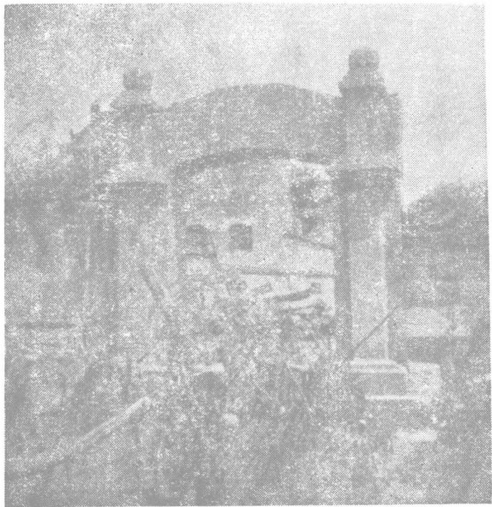
米脂三民二中校门