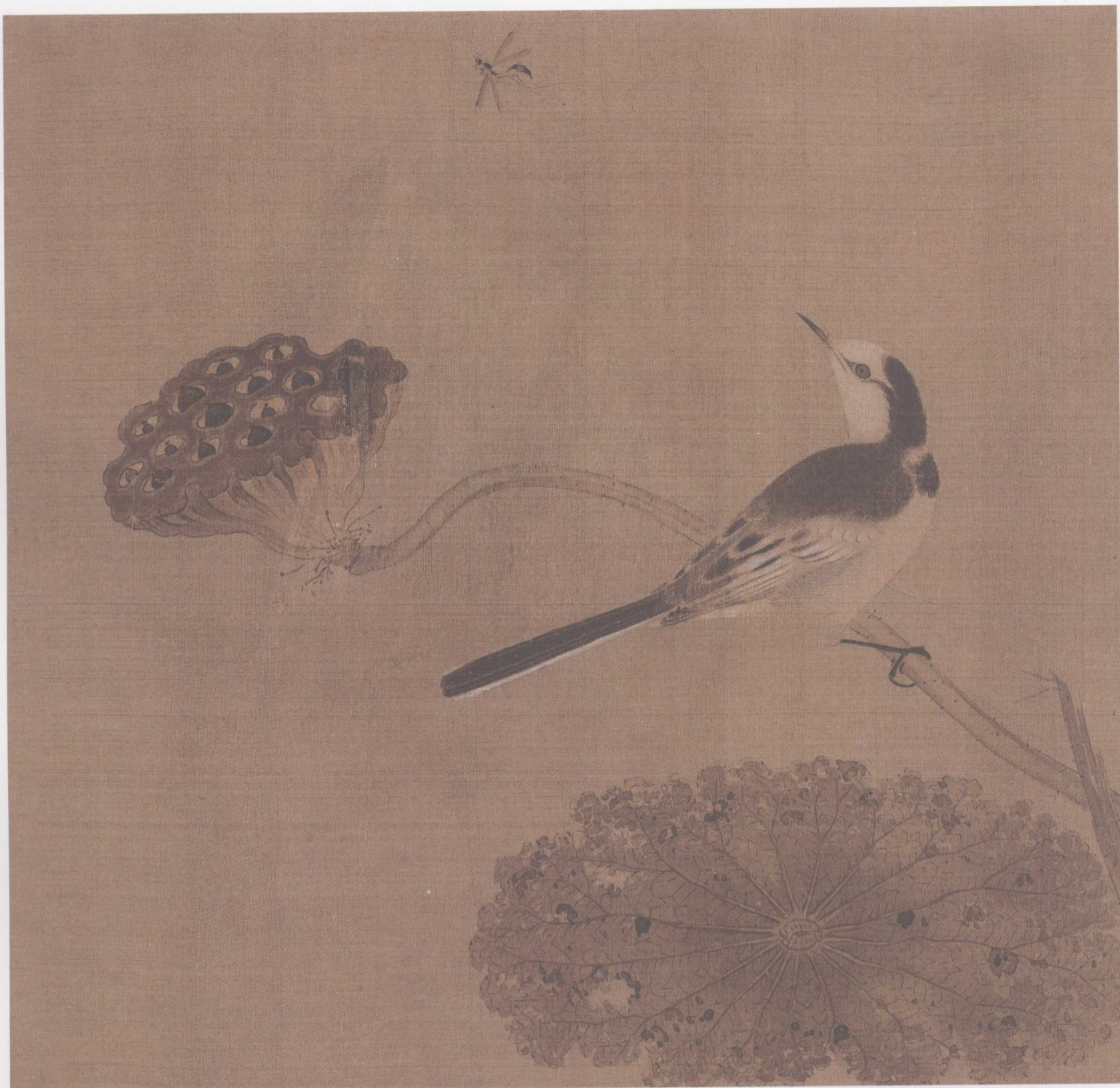
疏荷沙鸟图 马兴祖