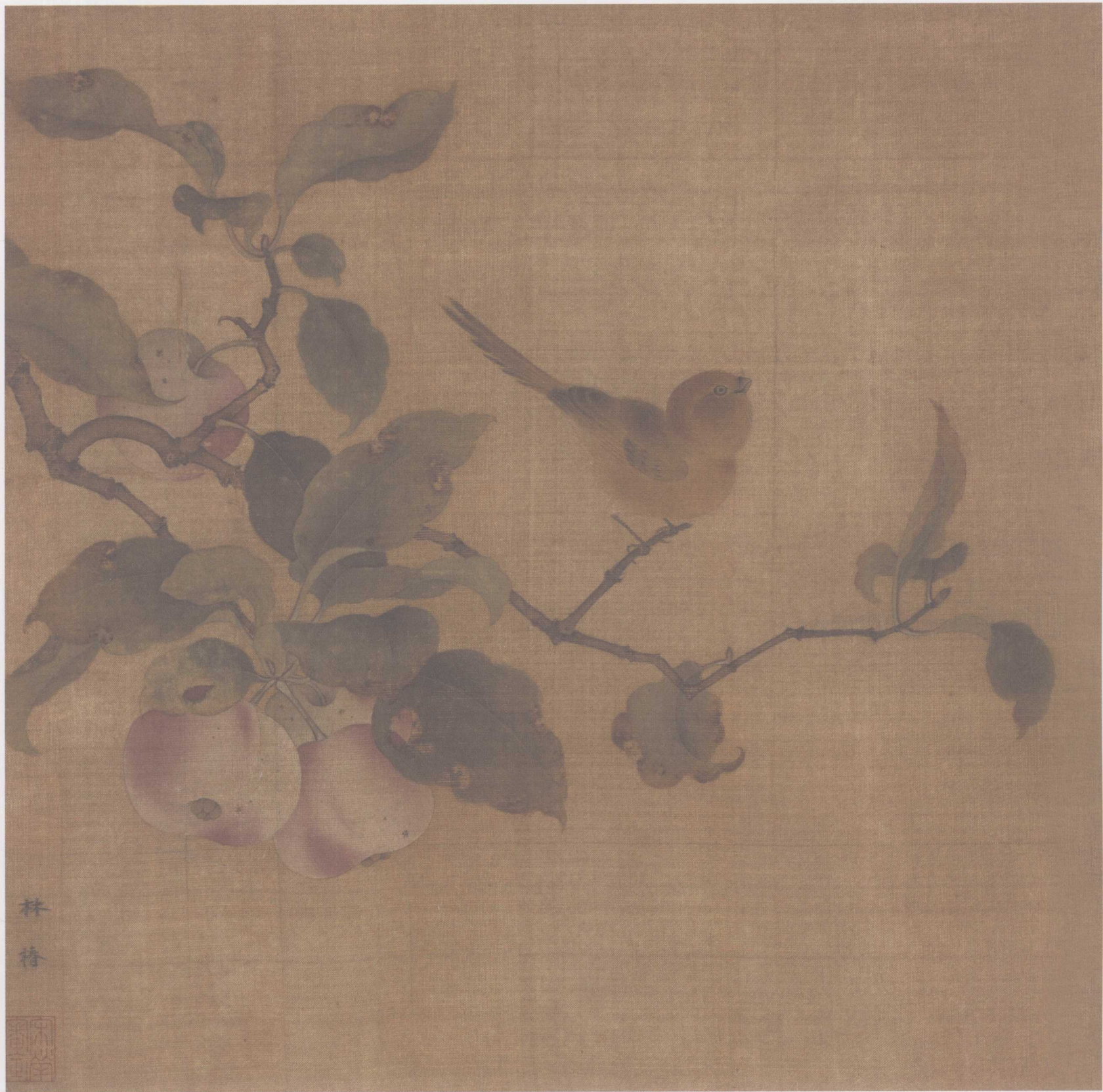
《果熟来禽图》宋 林椿 绢本设色 26.9cm×27.2cm

折枝，是花卉画的一种，指画花卉不写全株，只画从树干上折下来的部分花枝，故名。扇页之类的小品花卉画，往往以简单的折枝经营构图，弥觉隽雅。在中国美术史上，折枝花鸟的形式在中唐至晚唐之际的边鸾已始，到五代时，折枝画法已较为普遍，及至宋代，已成为花鸟画最常见的构图形式。正因为不是“全景式”的构图，所以，折枝花鸟作品在造型和构图上要求就更为严谨，多从边角取势，花叶的聚散关系、禽鸟的动态呼应，每一个局