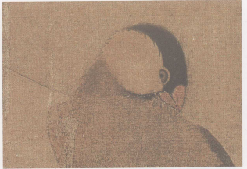
图2 宋人禽鸟作品局部