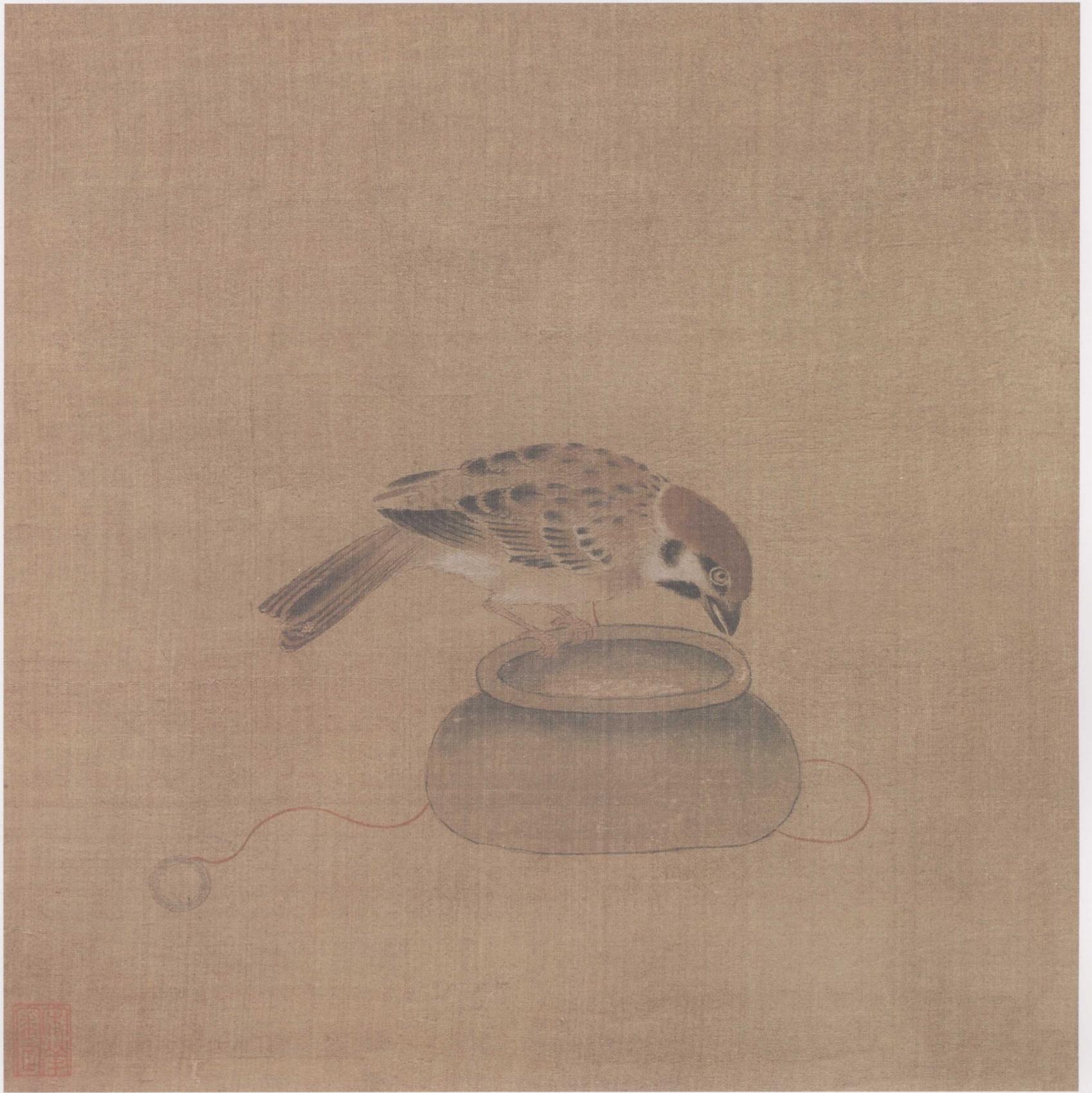
驯禽俯食图页 佚名