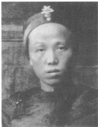
郭沫若的母亲杜邀贞

15岁嫁到郭家后，吃苦耐劳，性情温和，赢得了全家人的尊敬。在郭沫若幼小的时候，母亲教他背诵古诗、民歌。一首唐诗“淡淡长江水，悠悠远客情。落花相与恨，到地一无声”让他终身不忘。家乡民歌“翩翩少年郎，骑马上学堂，先生嫌我小，肚内有文章”，激发了他读书的好奇心。母亲给了他“诗教的第一课”，他在《三叶集》中说：“假使我也算是个诗人，那这个遗传分子确也是从我母亲来的了。”