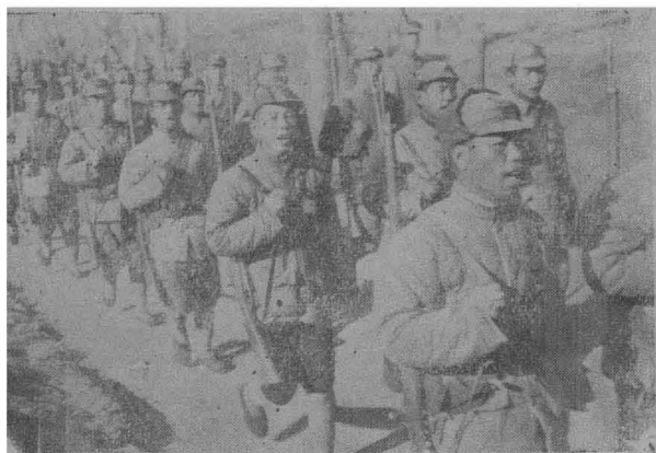
邊區第八路軍姿影

在平漢、正太、同蒲、平綏四路之間，他們控制了蔚縣（察南）、廣靈、渾源、應縣、涞源、靈邱、繁峙、五台、代縣、崞縣、忻縣、定襄、阜平、曲陽、唐縣、完縣、易縣、徐水、滿城、孟縣、壽陽、平定、井陘、平山、