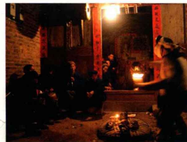
贵州傩堂戏 Guizhou Nuo opera