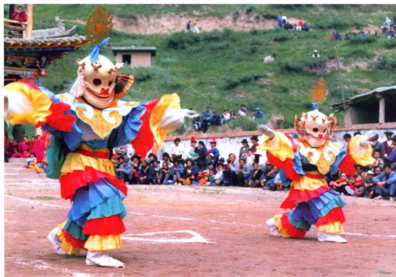
甘肃夏河拉卜楞寺毛兰姆跳神、鼓舞 (民族文化宫博物馆) Maolanmu dance to god and drum dance in Labuleng temple of Xiahe county, Gansu Province