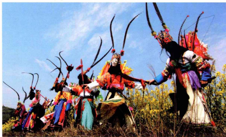
贵州安顺屯堡地戏 Dixi drama in Tunpu, Anshun, Guizhou Province

它能持续下去。这一军旅文化的传承，既是对子孙教化之需，也是使子孙记忆“历史”的形式。