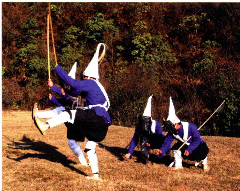
彝族撮泰吉 拓荒耕种 Cuo Tai Ji, the Yi Nationality

早在秦汉时期，宫廷傩礼即从神圣祭祀文化逐步向世俗化、艺术化、娱乐化转变，从而在民间被发扬光大，广泛流传在民间百姓之中，亦称为乡人傩。由于扎根在广袤的民间，民间傩有着异常顽强的生命力和创造力，在长期的发展中形成了于腊月流浪农村、沿门逐疫乞讨的“游傩”，带有社火性质的“社傩”，为保家族兴旺的“族傩”，带有祈祷许诺酬神性质的“愿傩”等诸多种类。还有一类保留着原始表演艺术的本来面目，已具备傩戏的基本特征，