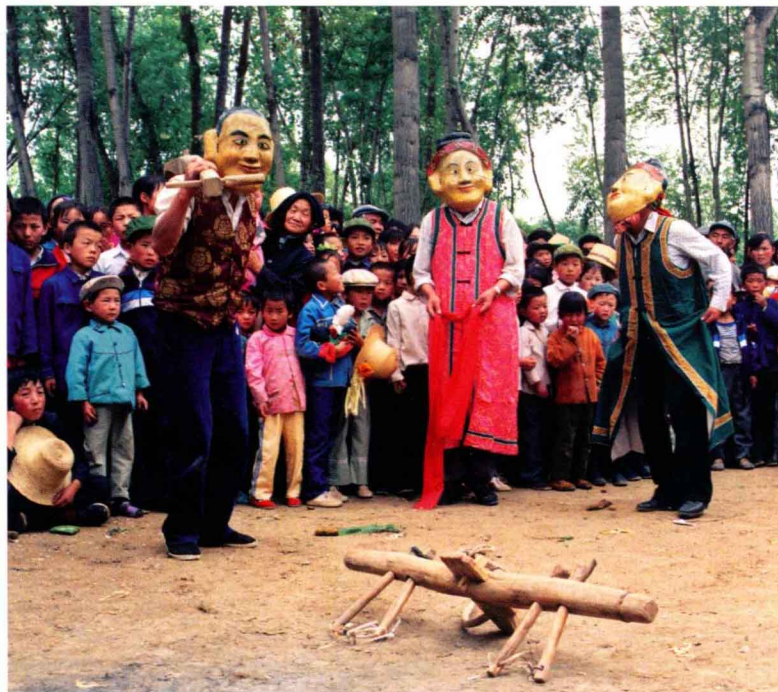
土族节祭舞蹈 (民族文化宫博物馆) Sacrifice Festival dance of the Tu Nationality