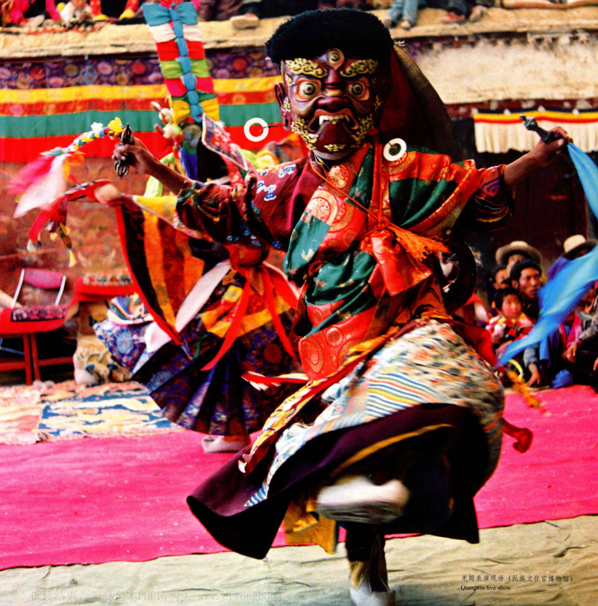
羌姆表演现场 (民族文化官博物馆) Qiangmu live show