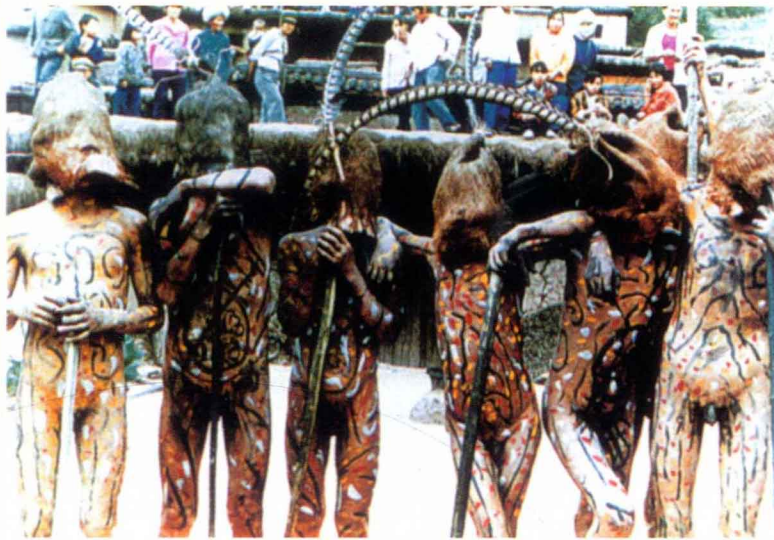
彝族裸体傩舞“余莫拉格舍”（撵鬼）（民族文化宫博物馆） Naked Nuo dance “Yumolageshe” (drive out ghost), the Yi Nationality

戴面具，边舞边唱边击鼓做分龙法事。湘西的瑶族大型傩祭名字叫“庆盘王”，以一人扮盘王，戴南瓜叶子，上身穿棕树叶制作的八卦衣，下身扎芭蕉叶做的法裙。由掌坛师率众歌舞，之后便是“造船”，用纸扎“瘟船”，船上有红、绿、白三色纸扎羊头，分别象征火殃、祸殃和孝殃，做完