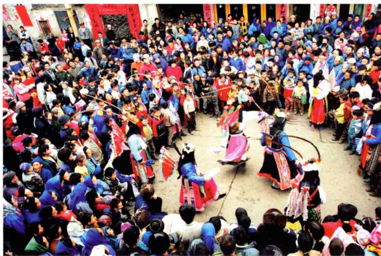
贵州安顺屯堡地戏 Dixi drama in Tunpu, Anshun, Guizhou Province

安顺屯堡地区盛行的民间戏曲形式被称为“地戏”，当地人叫它“跳神”。地戏在史料上的记载，最早出现在明嘉靖年间的《徽州府志》，其中提及的迎汪公的“假面之戏”，估计就是今安顺一带农村抬汪公时地戏队伍参与活动的源头。地戏演出地点不需要戏台，一般是村中的空坝子或者田地上。一年有两个演出季，一是稻谷扬花时祈求丰收，二是春节时祭祀祖先祈求来年风调雨顺、村寨平安。由于地戏的演出场地有限，作为表演者的农民也没有太多闲钱来制作道具舞美，因此在表演手法上多使用虚拟与象征来表现情实景：绕场一周就象征人马行程了百里，一颗小树可以是繁茂的森林，一张桌子就是巍峨的大山，一条白布就是汹涌的江河。军中傩呈现着“历史”信息，也使村民保持着对历史的记忆。它的形成实际上是对先辈征战历史的复演，将“历史”与祖先崇拜结合起来，更使