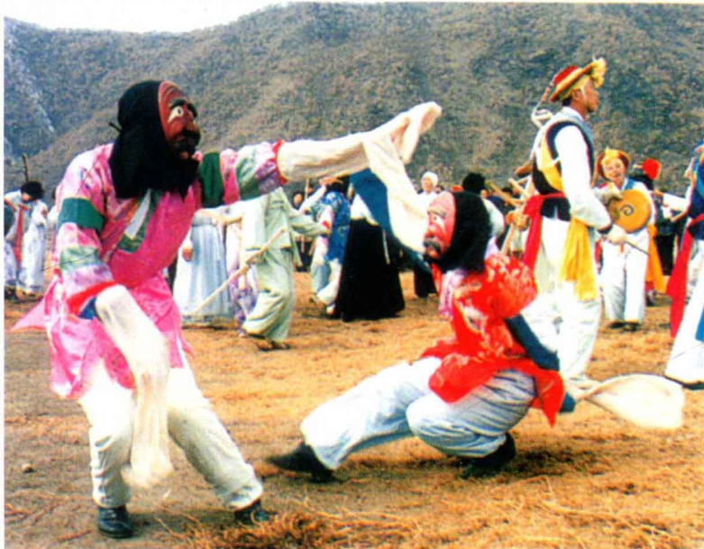
农乐舞中佩带面具的地神舞，吉林安图朝鲜族（民族文化宫博物馆） Land God dance with masks in Nongle dance, Korean in Antu, Jilin Province

戴面具，边舞边唱边击鼓做分龙法事。湘西的瑶族大型傩祭名字叫“庆盘王”，以一人扮盘王，戴南瓜叶子，上身穿棕树叶制作的八卦衣，下身扎芭蕉叶做的法裙。由掌坛师率众歌舞，之后便是“造船”，用纸扎“瘟船”，船上有红、绿、白三色纸扎羊头，分别象征火殃、祸殃和孝殃，做完