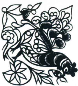
母鸡 (窗花) 陕西安塞 曹佃祥 13.2cm × 11.5cm