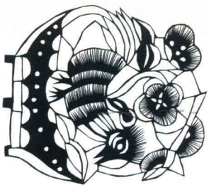
鸡·花篮 山东高密 范祚信 9.4cm × 10.8cm

The Cock and the Flower Basket Gaomi, Shandong Fan Zuoxin 9.4cm × 10.8cm