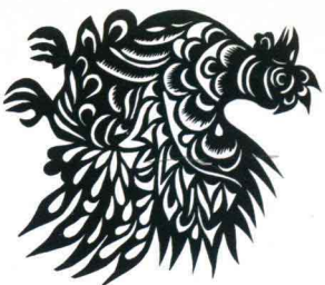
金鸡 (窗花) 陕西安塞 常振芳 18.0cm × 20.0cm