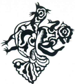
猴骑鸡 陕西延川 15.5cm × 13.8cm

The Monkey Rides the Cock Yanchuan, Shan'xi 15.5cm × 13.8cm