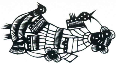
娃娃戏鸡 山东高密 4.6cm × 9.4cm

The Kid Plays with the Cock Gaomi, Shandong 4.6cm × 9.4cm