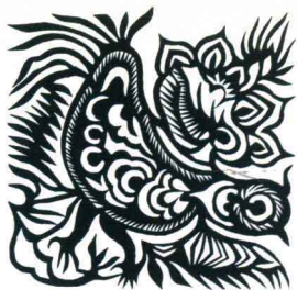
鸡 陕西延川 11.8cm × 11.8cm