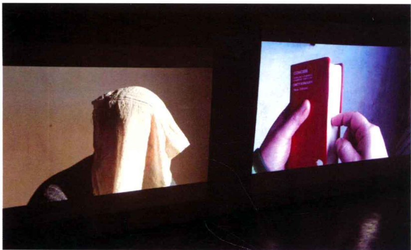
▲ 《姨子的儿子》（左），录像，2010