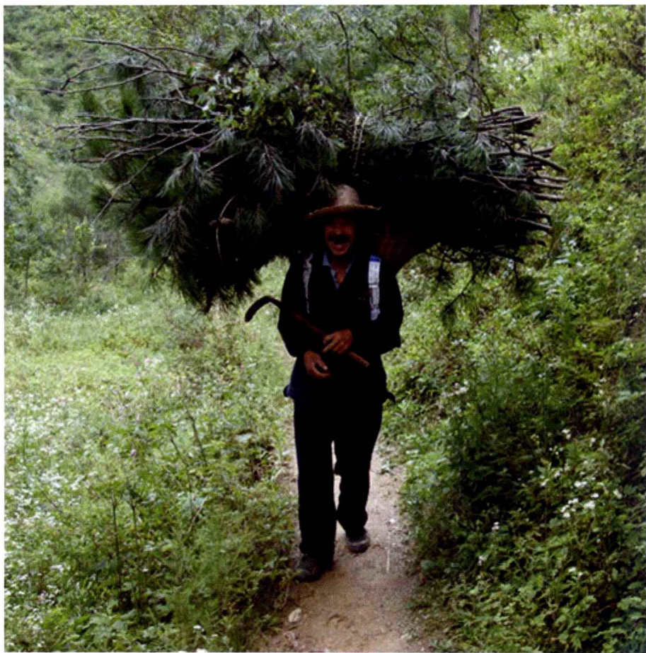
④ 乡间小道上的柴草背篓