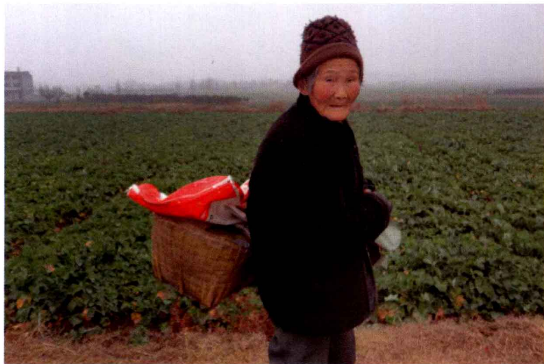
⑬ 冬日田埂上，镜头前略显局促的老人家