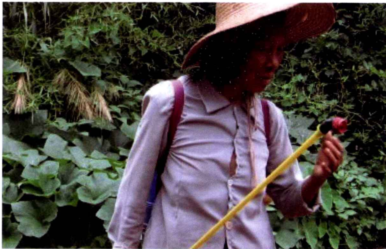
⑨ 变的是年龄，不变的是农民的勤劳与细心

拍摄地点：新疆泽普县依玛乡米尔皮格勒村，时间为2012年8月