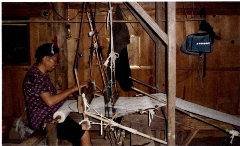
② 木质结构的农家小屋，传统技艺纺纱的水族老人

拍摄者：侯江华 华中师范大学政治学研究院2011级政治学理论专业博士 拍摄地点：贵州省三都水族自治县三合镇龙台村，时间为2012年8月