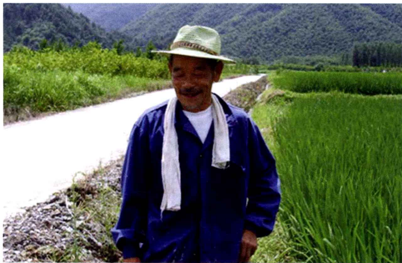
③ 碧绿的农家稻田，欣慰的皖南老农

拍摄地点：贵州省三都水族自治县三合镇龙台村，时间为2012年8月