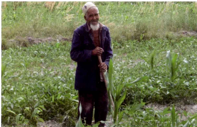
⑧ 劳有所乐的维吾尔族老大爷

拍摄者：阿布都色买提 华中师范大学政治学研究院2009级政府经济学专业硕士 拍摄地点：新疆泽普县依玛乡米尔皮格勒村，时间为2012年8月