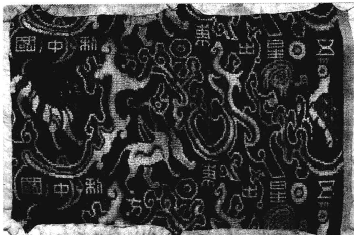
1995年，中日联合考察队在新疆和田尼雅遗址发掘出土的“五星出东方利中国”汉代织锦。