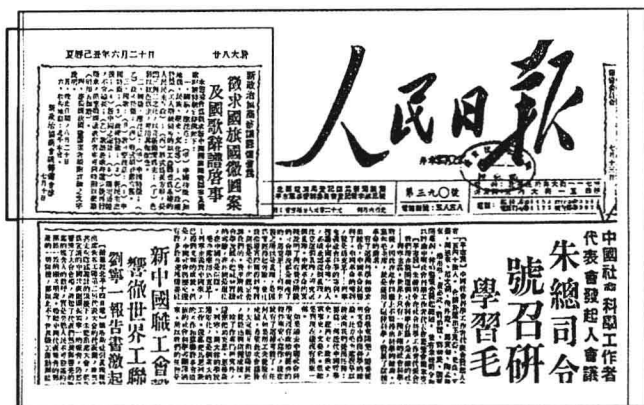
《人民日报》刊登《征求国旗国徽图案及国歌歌词启事》。