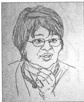
宮部美雪 Miyabe Miyuki (1960— )

原名“矢部美雪”，一九六〇年出生于东京。毕业于东京都立墨田川高校。二十三岁进入法律事务所工作，白天在法律事务所当速记员，晚上到讲谈社主办的小说写作研习班学习写作。一九八七年以《邻人的犯罪》出道，几年间拿下所有相关的文学奖项，并连续七年成为日本最受欢迎的女作家，得到“平成天后”的称号。在日本出版界，有着“男东野，女宫部”的提法，其魅力可见一斑。许多日本作家认为，宫部美雪最有资格继承吉川英治、松本清张和司马辽太郎的衣钵，还将她封为“松本清张的女儿”。