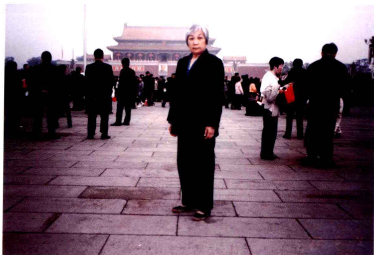
2002年秋季，母亲在北京天安门广场