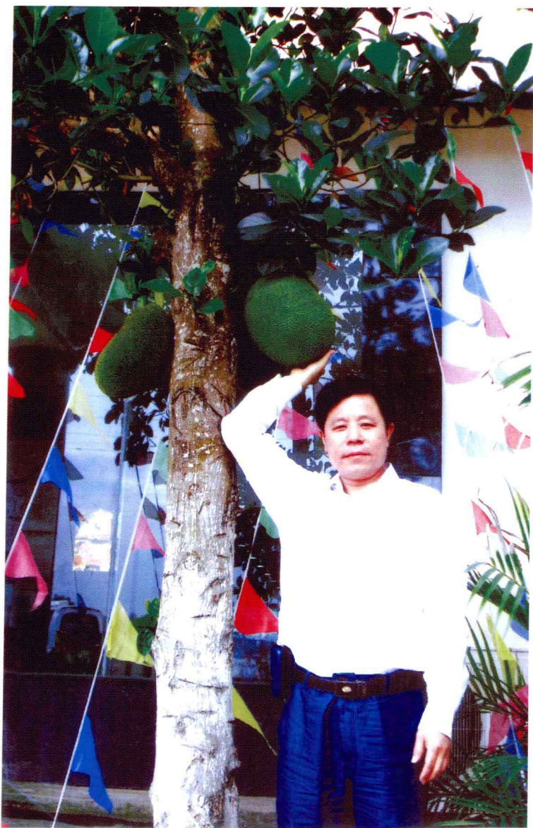
2007年春，作者在云南西双版纳