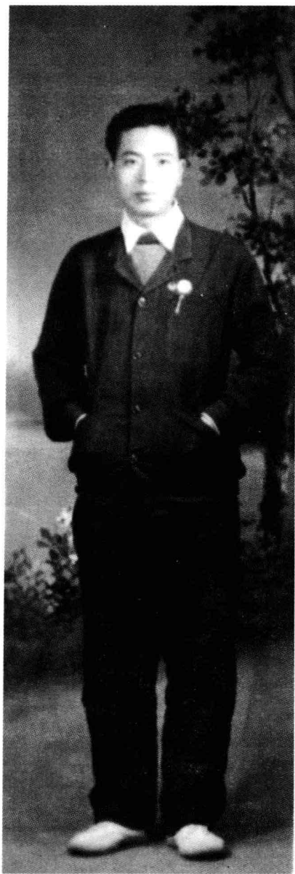
1961年春，父亲在洛阳市邮电局试习期间留影