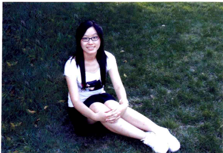
2007年9月女儿在中国矿业大学校园内