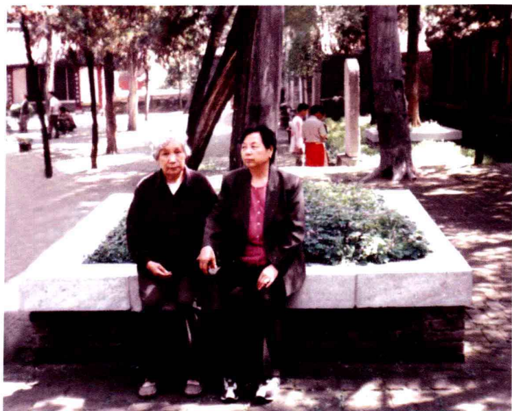
2005年“五一”母亲和岳母在河南旅游景点