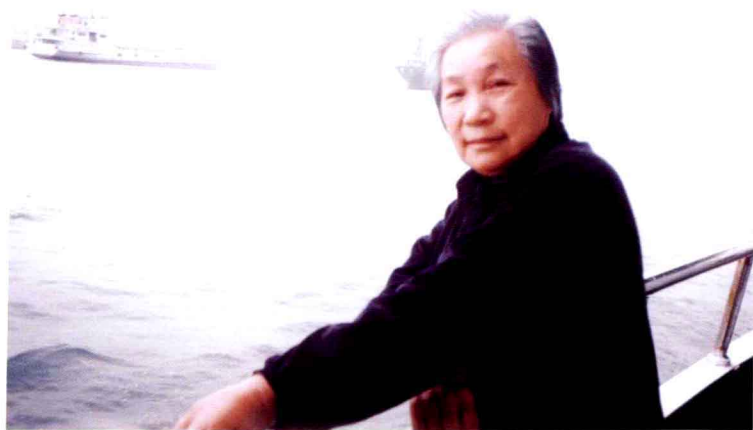
2003年，母亲在广东湛江