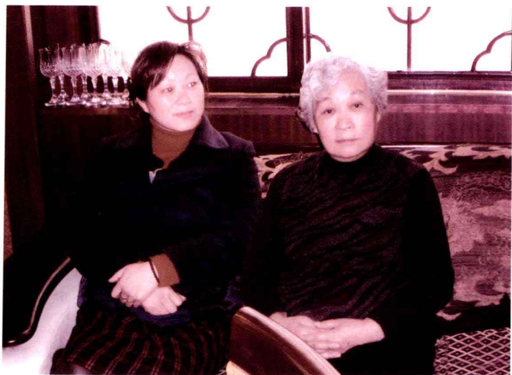
摄于母亲68岁生日，母亲和妻子在一起