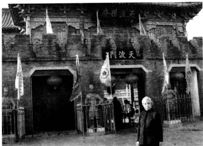
2004年10月母亲在河南开封