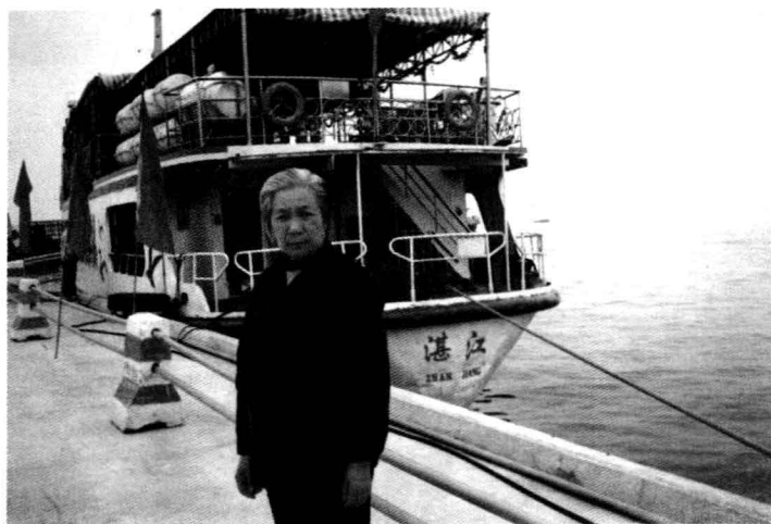
母亲2003年冬在广东湛江海港