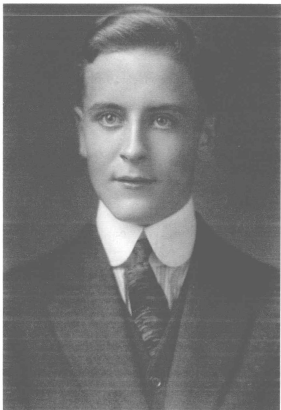
1911年，菲茨杰拉德就读于哈肯萨克的一所私立中学。