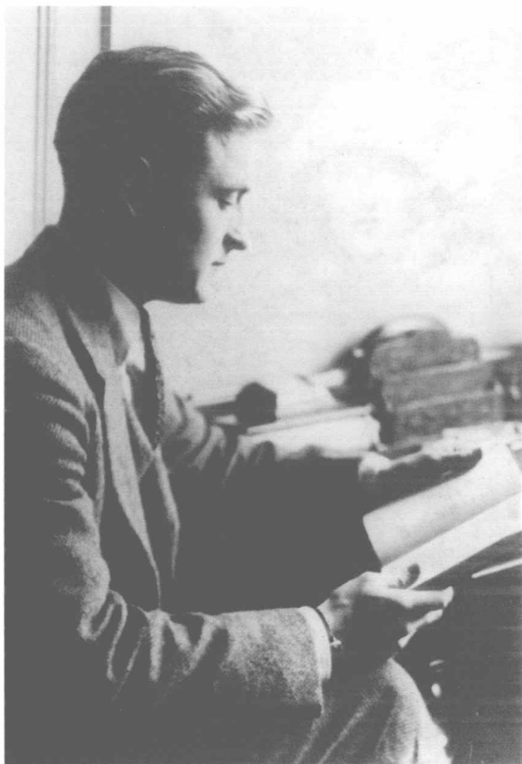
自小就爱看书的菲茨杰拉德，这一习惯伴随他一生。