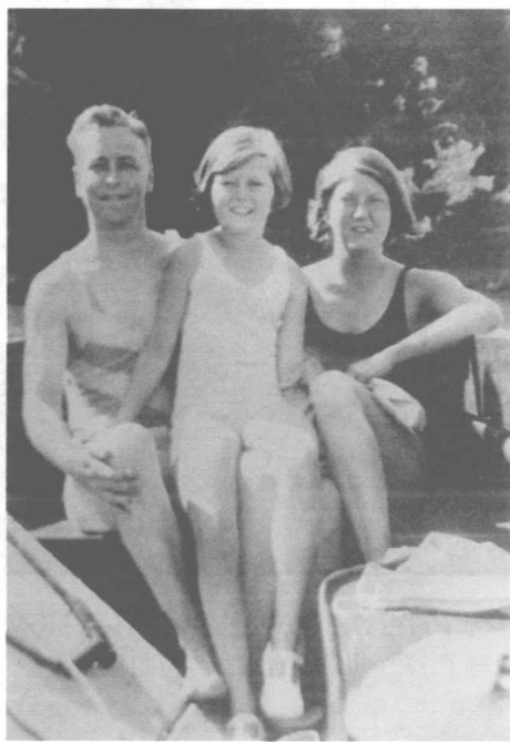
菲茨杰拉德夫妇与他们唯一的女儿斯科蒂。1929年，经济危机的阴霾浮现，挥金如土的二十年代走入尾声。