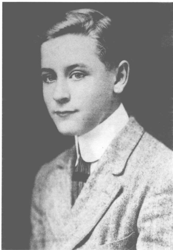
1896年9月24日，菲茨杰拉德出生于明尼苏达州圣保罗一个中产之家。