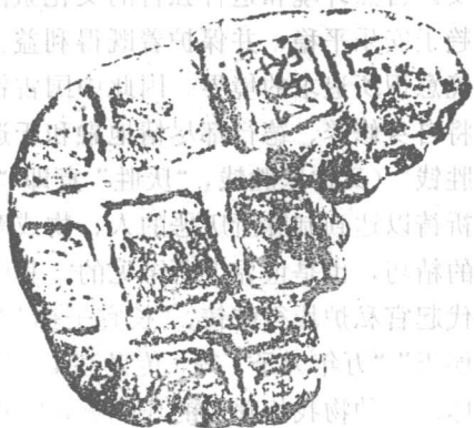
战国墓出土陶质郢爰冥币

陪葬用的冥币(图2)。中国钱币以自然生产工具、战争工具与环境相依赖而发展起来。从崇拜生产工具和战争工具(刀币)，利用生产战争工具，丰富自己的环境审美观念。中国钱币从一开始，即开始人神相通，人鬼通用。即人间有的，阴间(冥钱)均用。被称“瘞(音义)钱”，“明器”专为死者