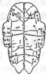
图 1 刻有卜辞的龟甲

由于地理位置的差异，文明史的源流发展及发展方向的不同，世界各地域和我国不同朝代地区的文化形态，都使古钱币发展环境及钱币的艺术具有各自鲜明特质。这种地区性与民族性，正是古钱币的多样性的基础。中国钱币起源，是以动物作为钱币，如龟贝。中国贝币是商