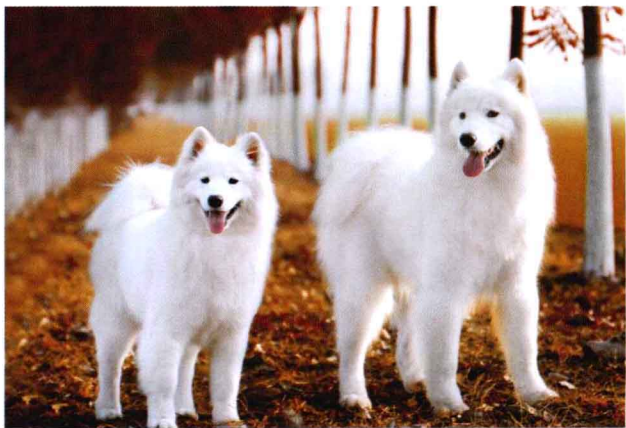
训练宠物犬是饲养过程中的又一课题

一只狗的气味可以使另一只狗知道它的领地、性别、年龄和健康等状况。比较胆小的狗或是幼犬之所以不敢在外面小便，就是怕侵犯到大狗的势力范围。有趣的是，一只体型小的犬经过体型大的犬留下的领地痕迹时，会尽量抬高它的后肢撒尿来盖住体型大的犬留下的痕迹；而体型大的犬在路经体型小的犬留下的痕迹时，会尽量以低于正常的姿势排尿，以覆盖体型小的小犬留下的痕迹。一般会做标记的都是公狗，不过，偶尔也有一些“女权主义”的母狗，会和公狗一样抬起腿来小便，用尿来标志领地界限或是规定道路，但母犬的领地感并不像公犬那样强，它只在发情期时，为了告诉周围的公犬它正处于发情期才会这样做。平时，母犬并不像公犬那样重视自己的领地和自己在犬群中的地位，它们只注意保护自己的犬仔，犬群里有许多母犬始终都和睦地生活在一起，它们甚至可以喂养其他母犬的幼仔。