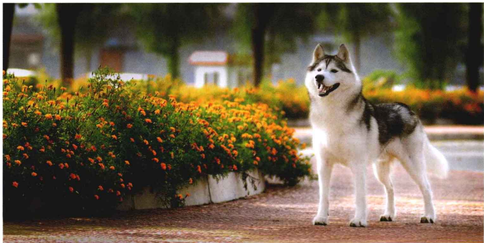
经过千百年的驯化，当年凶狠的狼成为人类最忠实的朋友

据统计数字表明，目前世界上犬的总数在5亿只左右，具有纯正血统的名犬大约有400余种，被人们所喜欢并常见的名犬约有100余种。我国也曾培育出北京犬、巴哥犬、松狮犬、拉萨犬、西施犬、中国冠毛犬、西藏猎犬、沙皮狗、藏獒等世界名犬。我国古时曾将犬分为獒、龙、豺狗、绵狗、鬲狗、屈膝狗、谋犬、獠犬、蛮犬、牧羊犬等几大类。