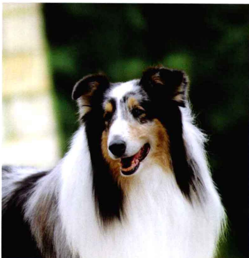
每种犬都有自己的性格，有的天生安静，有的活泼好动

对于人给出的口令，犬可以根据音调、音节的变化产生条件反射，明白主人的意图并且执行。犬可以听到很轻的声音，过高的音频对犬则是一种强烈刺激，会使狗很痛苦。所以只要不是为了纠正狗的错误行为，对狗狗说话要尽量温柔，并且不要带狗狗到噪音较大的地方去。