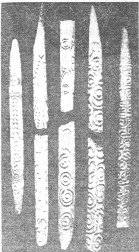
带有抽象纹饰的骨制权杖马格德林文化时期

超自然的力量引向对方，以达到控制和伤害的目的。它的表现方式通常是用器物或符号指向对方，同时施加咒语，这种一般是远距离操作；另外便是人类学家们通常所谓的“交感巫术”，即对动物身体或模拟物施加伤害动作。考古学家们发现，许多岩壁上的动物绘画或刻线内，都有各种被击打的痕迹。防卫性巫术的作用在于吓退或驱除对己有害的力量，通过随身携带护身符之类的物品，并遵守一定的禁忌，另外还可通过净身、放血等行为达到清除想象中的邪恶力量的目的。