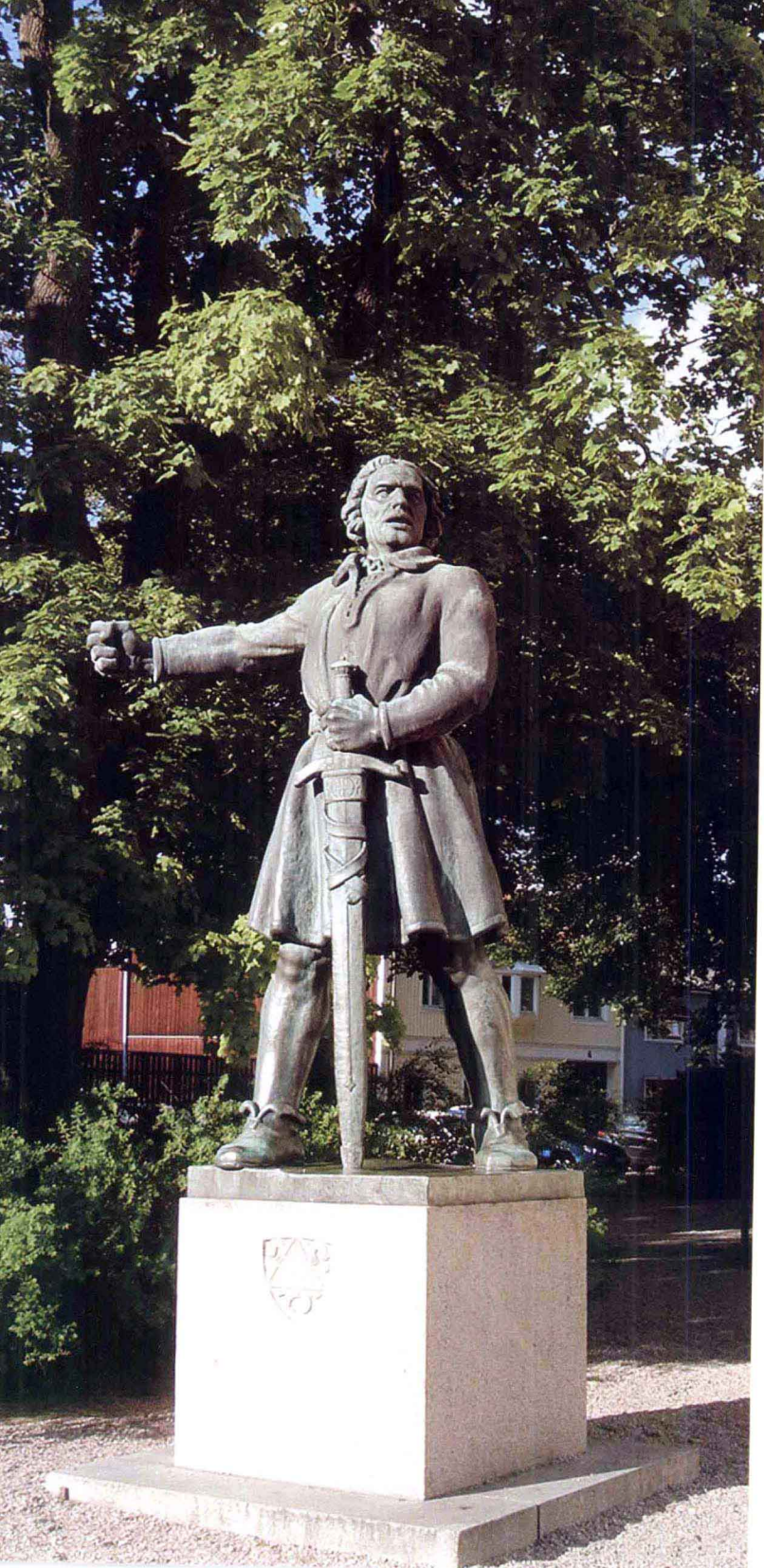
恩厄尔布雷克特雕像