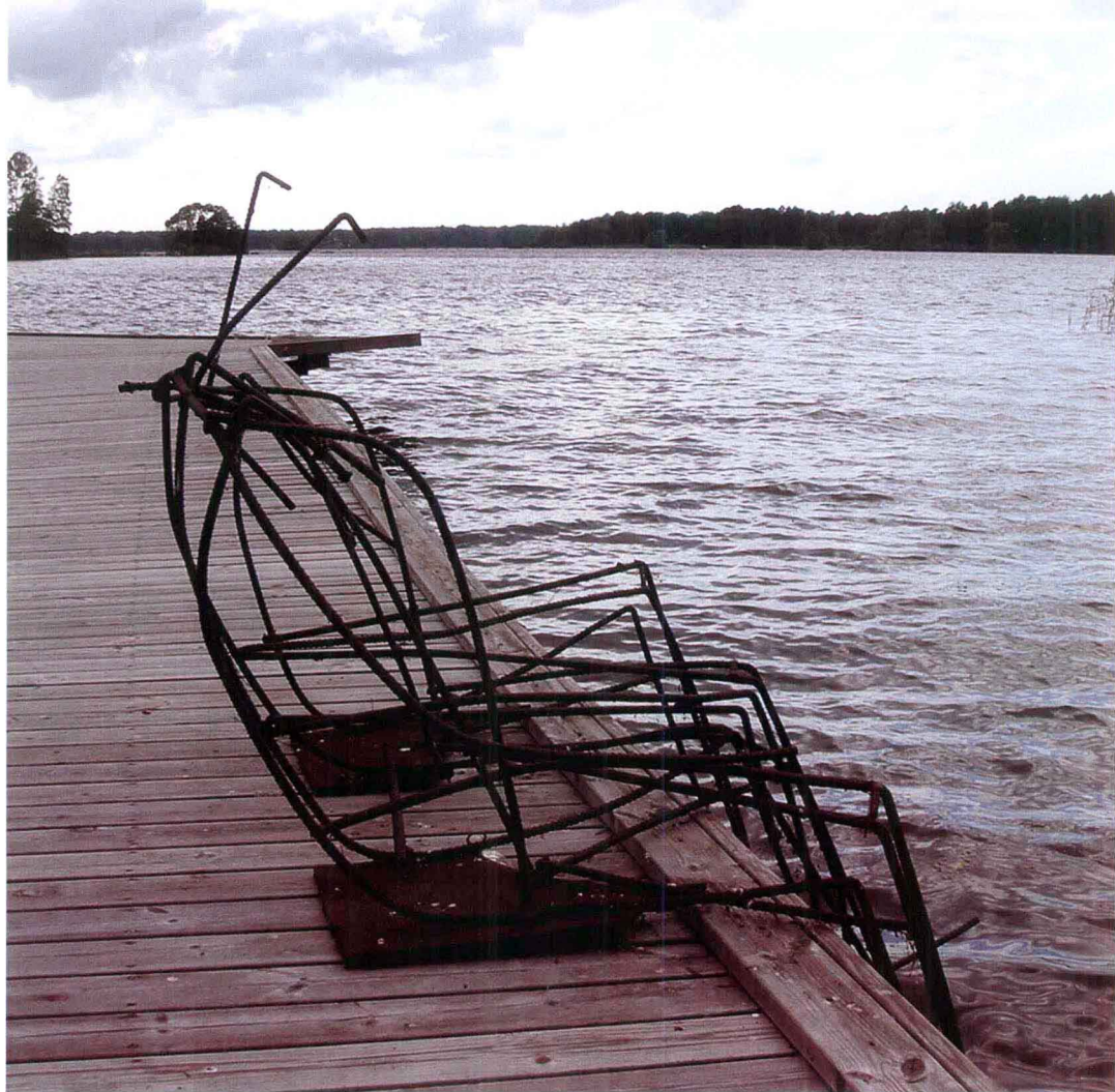
自然、人、艺术相生相融

他找来核引擎头、化油器、燃料注入泵和雷达设备的部件，经过精密做工，许教授把原本分散的材料精准地组装成一体，他的创意是将毁灭性武器转变成美好的和平之物。除了雕塑和演讲，他的“钢笔”是其与世人交流的另一方式，看到令人恐惧的导弹恶物蜕变为可以签署和平条约、反战宣言或是书写华美诗篇、编著超胆英雄科幻小说的和平之“笔”，阿尔博加人感到心潮澎湃，此无愧为大师杰作！