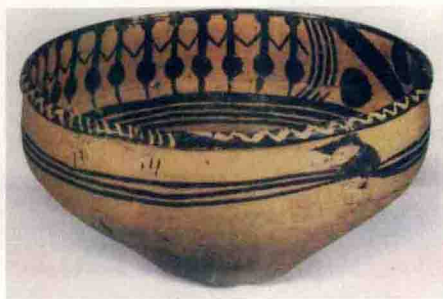
◇新石器时代陶器 ——舞蹈纹彩陶盆