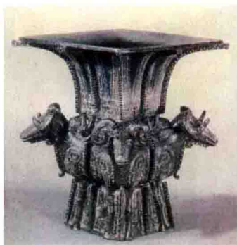
◇商代青铜器 ——四羊铜尊