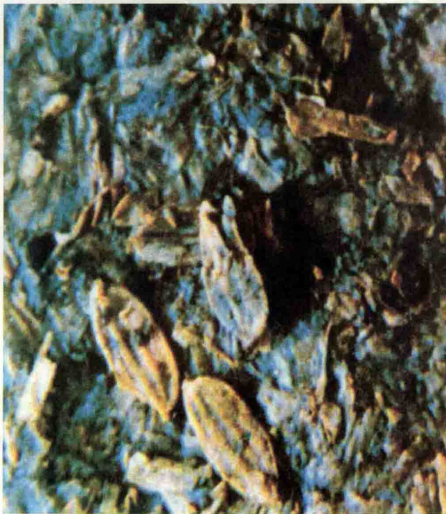
◇河姆渡遗址的稻谷遗存

中国是古老的农业国家，先民们很早就种植水稻和粟，形成两大农业体系。同北方黄河流域的粟作农业不同，河姆渡遗址以稻作农业为主，主要种