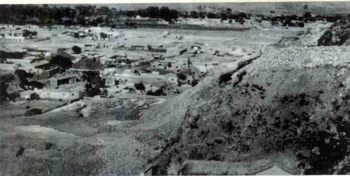
◇ 1931年时周口店北京猿人遗址