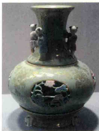
◇清代粉青釉描金镂空开光粉彩荷莲童子转心瓶

中国历史悠久，是四大文明古国中唯一一个历史发展没有中断的国家。从50万年前的北京人时代算起，华夏大地上历经旧石器时代、新石器时代、青铜时代、铁器时代，也经历过2000多年的封建王朝更替。每一个时代，都在这块广袤的土地上留下了浩如烟海的珍贵文物，其中，同一时期出土的文物价值高且丰富的地点，我们可以称之为宝藏。这些文物宝藏，绝大多数位于地下，有遗址，有墓葬，也有窖藏；地面上的则主要是石窟、建筑物等。因篇幅所限，本书只能选取一些较为重要的宝藏加以介绍。