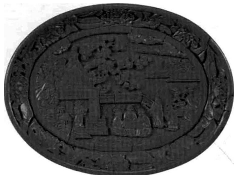
图6 明永乐楼阁人物图盘（偏橙色的剔红器）

时至明代，雕漆工艺又有了很大的发展，在这里就明代，特别是将初期的永乐、宣德时期的宫廷用雕漆器作为焦点，对若干特征和问题进行阐述。