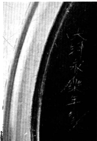
图8 永乐剔红器上的针书细款