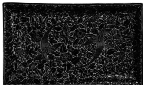
图4 南宋剔黑花鸟纹盘