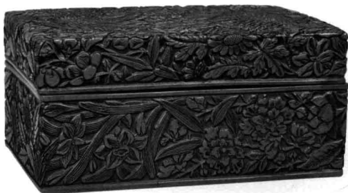
图3 南宋剔红花鸟纹盒