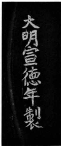
图9 宣德漆器上的刀刻填金款