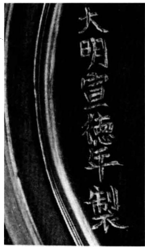
图10 刀刻漆金款下的针书细款