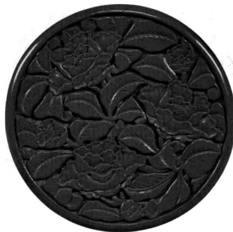
图7 明永乐牡丹纹盘（偏黑红色的剔犀器）